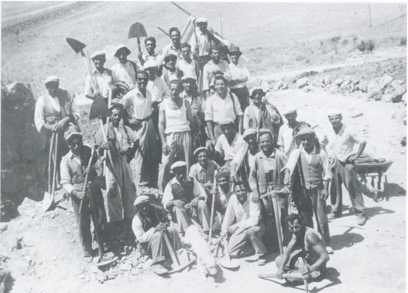
Abb. 2 - Jahr 1951: Die Männer von Su Nuraxi (da Murru 2000, S. 47).