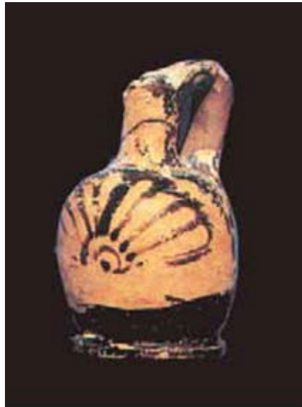
Abb. 2 - Lekythos Ariballica mit roten Figuren, Hütte oo, Su Nuraxi (aus: Lilliu, Zucca 1988, Abb. 35, S. 62).

bis zur Schulter angesetzt. Der vordere Teil weist ein phytomorphes Dekor auf, bestehend aus einem Palmzweig mit 9 Blättern (Abb. 2). Es handelt sich um importiertes attisches Geschirr, das belegt, dass der Nuraghenkomplex von Puniern frequentiert wurde (5. bis 4. Jahrhundert v. Chr.).