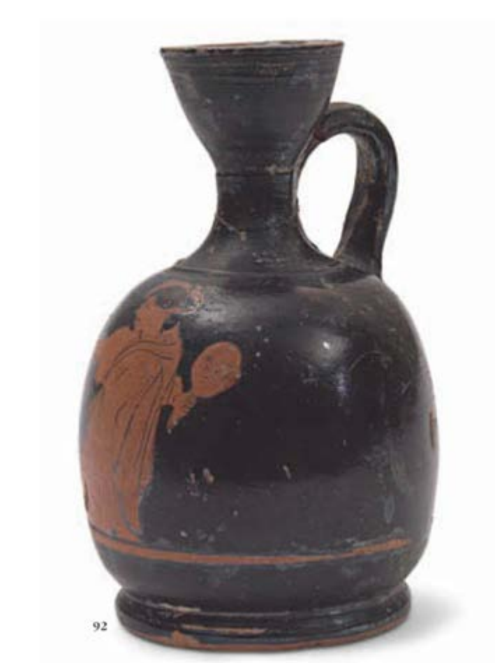
Abb. 4 - Lekythos Ariballica mit roten Figuren aus Tharros (aus: Zucca 2007, Abb. 92, S. 60).

Eine attische Lekythos Ariballica mit roten Figuren (5. Jahrhundert v. Chr.) aus der südlichen punischen Nekropole von Tharros (Abb. 4).