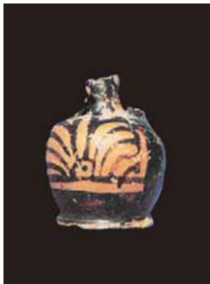
Abb. 3 - Lekythos Ariballica mit roten Figuren, Hütte vv, Su Nuraxi (aus: Lilliu, Zucca 1988, Abb. 34, S. 62).

Das Fundstück kann mit einem Fund aus der Hütte vv des Dorfs Su Nuraxi verglichen werden (Abb. 3).