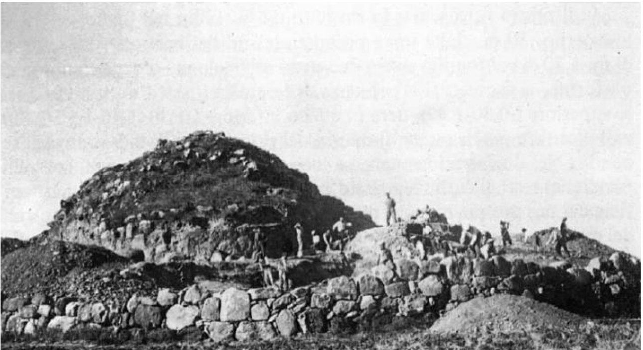
Abb. 3 - Jahr 1951, Su Nuraxi, die Grabungsarbeiten. Im Vordergrund die Mauer, dahinter der Turm D der Bastion (aus: Lilliu, Zucca 1988, Abb. 11, S. 32).

In den 50er Jahren beschloss zusammen mit dem damaligen Superintendenten für die Archäologie Sardinien, Gennaro Pesce, systematische archäologische stratographische Grabungsarbeiten durchzuführen, um die Nuraghe ans Licht zu bringen, die nahezu vollständig von Erde, Gestein und Vegetation bedeckt war, die die Zerstörung über Jahrtausende verhindert hatte. Die Grabungsarbeiten wurden von der Region Sardinien finanziert; dabei wurde nahezu 100 Arbeiter aus dem Dorf eingesetzt und sie dauerten ununterbrochen von 1951 bis 1956 (Abb. 3, 4, 5, 6).