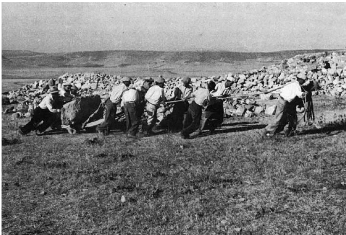
Abb. 5 - Jahr 1954, Nuraxi, Baustellenarbeiten (aus: Murru 2000, S. 41).