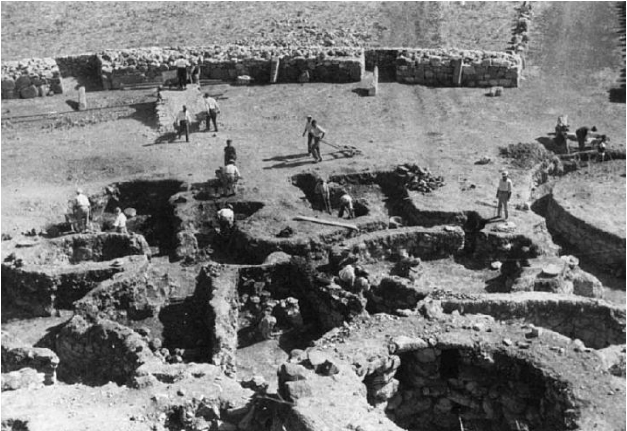
Abb. 6 - Jahr 1954, Su Nuraxi, die Ausgrabung des Dorfs in der Nähe der Mauer (aus: Lilliu, Zucca 1988, Abb. 14, S. 35).

Die Resultate der archäologischen Untersuchungen sind der wissenschaftlichen Veröffentlichung Il nuraghe di Barumini e la stratigrafia nuragica zu entnehmen. Lilliu schrieb: Beträchtliche finanzielle Mittel und viele Männer aus dem Dorf wurden bei den Grabungsarbeiten eingesetzt, um den „Giganten aus Stein“ freizulegen und um die architektonischen Geheimnisse des Bauwerks zu erforschen.