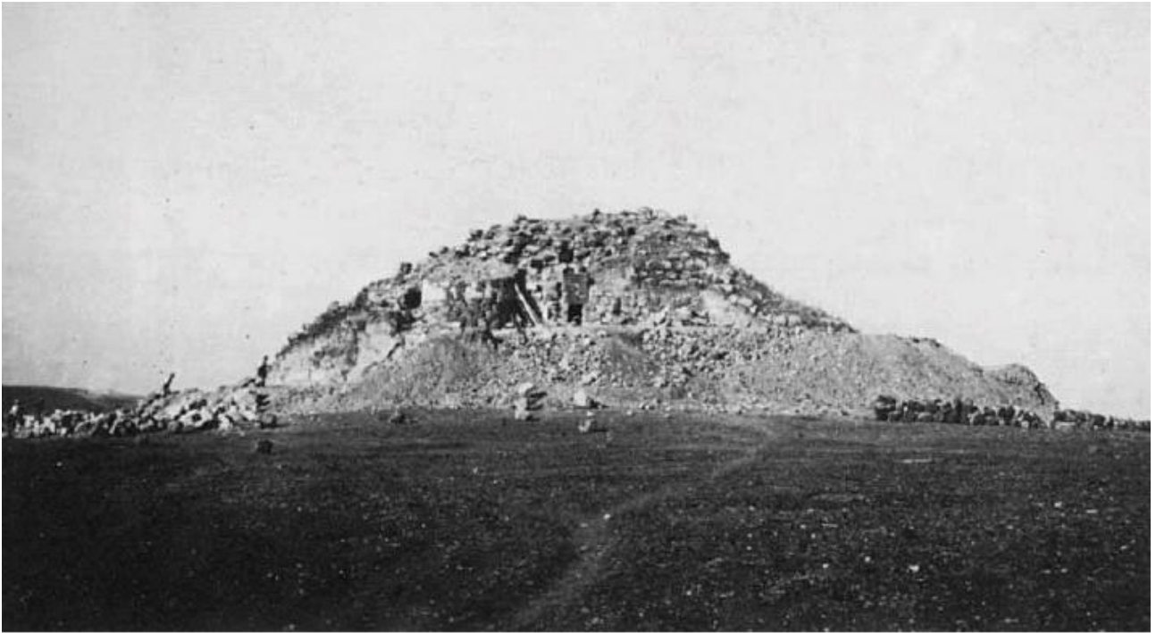
Abb. 4 - Jahr 1951: Die laufenden Grabungsarbeiten (aus: Murru 2000, S. 21).