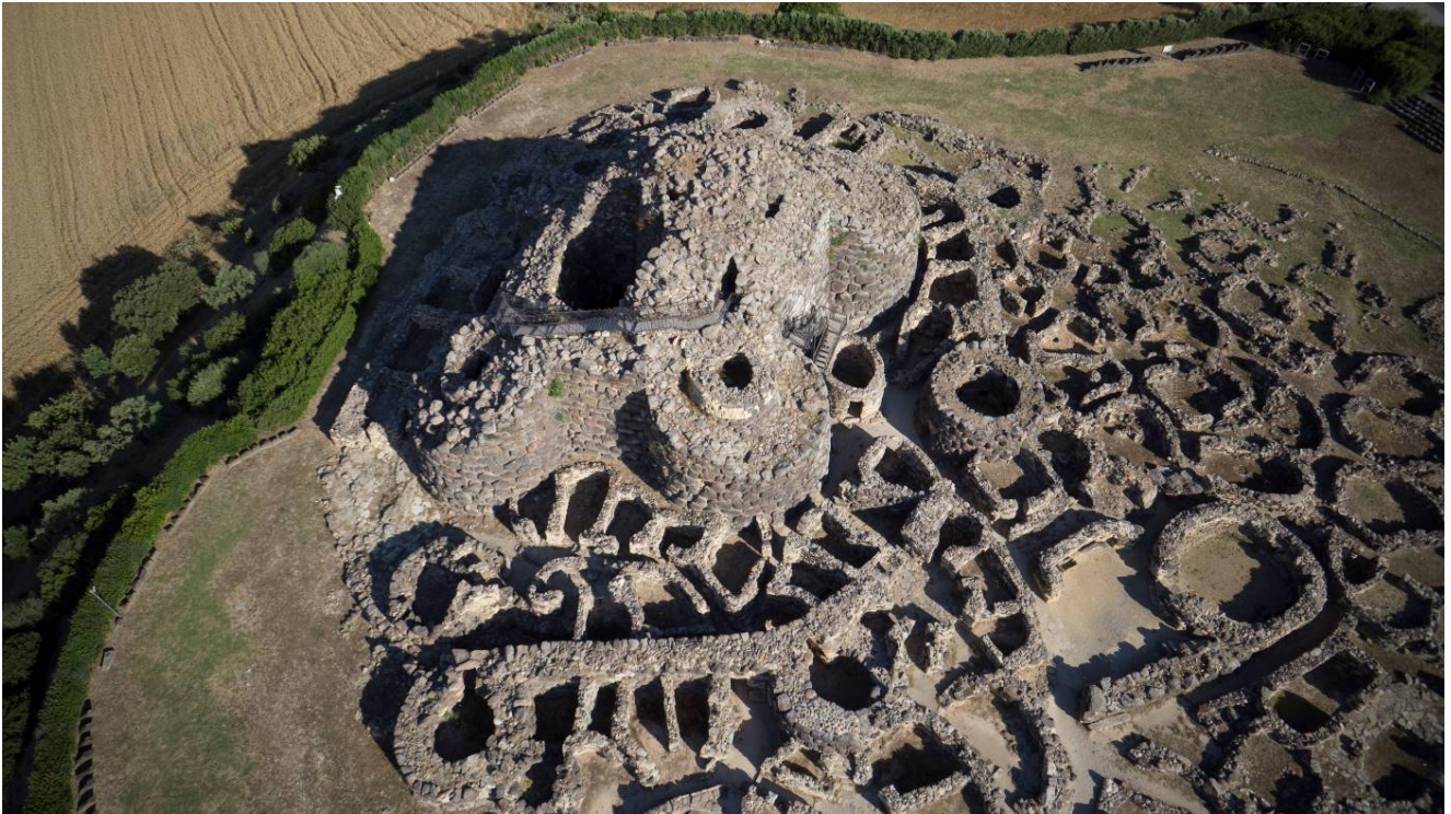
Abb. 9 - Luftbild des archäologischen Bezirks.

Su Nuraxi ist heute das in der Welt am besten bekannte nuraghische Monument, auch dank der Aufnahme in das Weltkulturerbe der UNESCO im Jahr 1997 (Abb. 9).