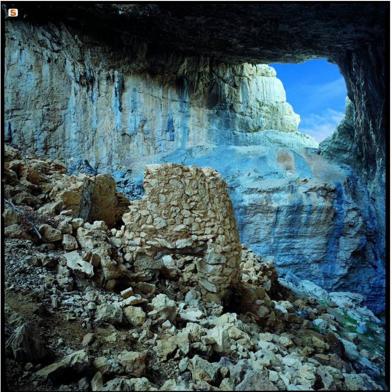
Abb. 1 - Das Dorf Tiscali.

Seit damals haben Jahrzehnte des Verfalls und der Plünderung zu beträchtlichen Schäden geführt, aber dennoch bleibt dies ein sehr eindrucksvoller Ort.