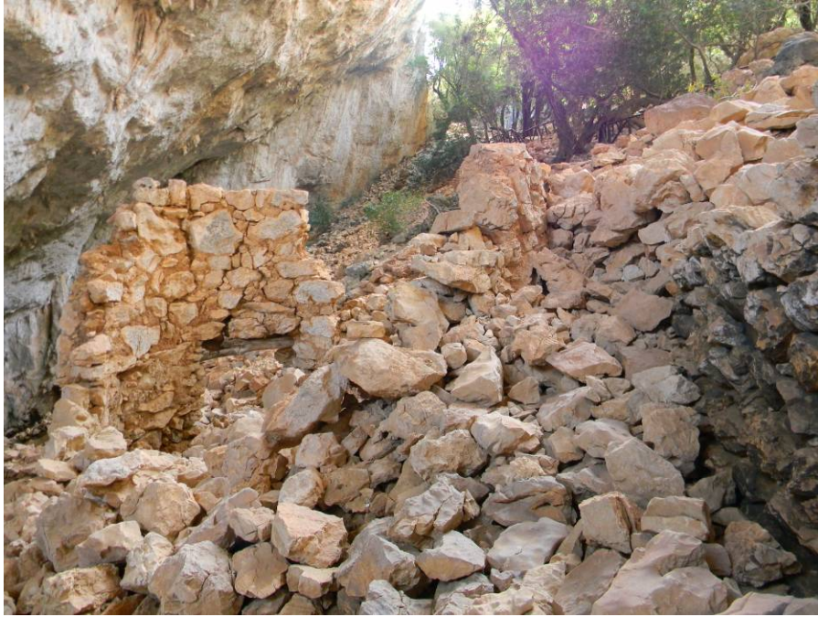
Abb. 3 - Einsturz der Bauten des Dorfes Tiscali.