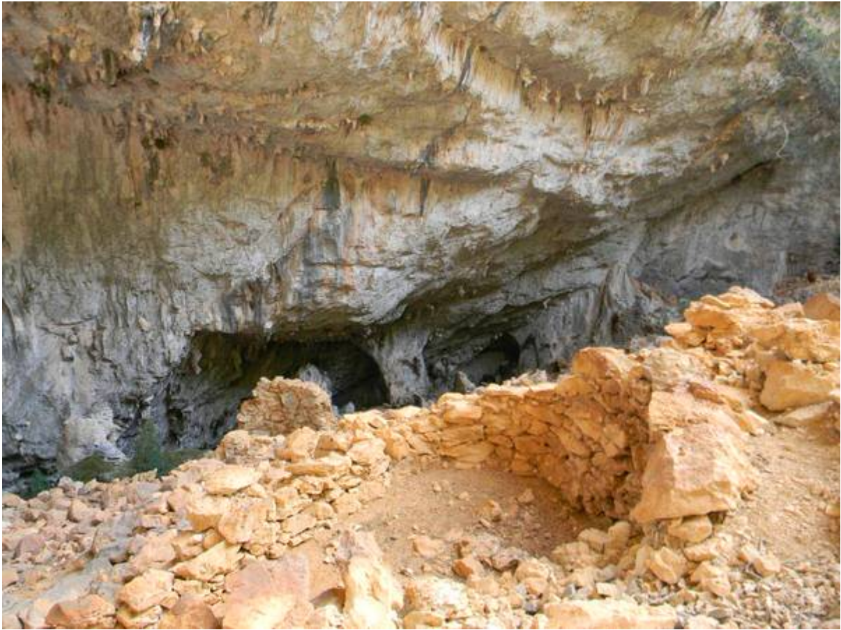
Abb. 2 - Details des Dorfes Tiscali.

Die erste Siedlung besteht aus ca. 40 Hütten und sie befindet sich im nördlichen Bereich der Doline. Die zweite befindet sich auf der Südwestseite und sie besteht aus ca. 30 Hütten. Die heute zum größten Teil eingestürzten Räume weisen einen rechteckigen, runden oder subelliptischen Grundrisse auf. Die Mauern mit recht geringer Stärke wurde aus grob behauenen Blöcken aus lokalem Kalkstein und Mörtel errichtet, der durch Mischung von Lehm, Kies sowie organischem Zuschlag gewonnen wurde, wobei die Risse zwischen den einzelnen Steinen mit Mörtel verfügt wurden; anschließend wurde der Mörtel der Form der Wände folgend geglättet. Auf der Innenseite der Mauern wurde Nischen ausgespart. Einige Bauwerke weisen vorspringende Wände auf und wiesen ursprünglich wahrscheinlich ein konisches Dach aus Ästen auf. Eines der Bauwerke weist einen Eingang mit Architrav aus Holz auf (Abb. 4).