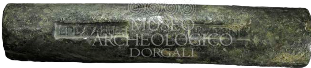
Abb. 3 - Bleibarren, der in den Gewässern der Cala Cartoe-Dorgali gefunden wurde, datiert auf das 2. bis 1. Jahrhundert v. Chr..

Eine der Ortschaften, auf die Bezug genommen werden muss, um die Geschichte der Landschaft und die Geographie des Territoriums zu definieren, ist die römische Station Viniolae bei Dorgali (Fundstätte Finiodda, Oddoene-Tal), die im Itinerarium Antoninianum erwähnt wird, an der Straße a Portu Tibulas Karalis . An dieser Straße, die an der Ostküste Sardinien verläuft, befinden sich die meisten der bekannten Siedlungen. Weitere Siedlungen befanden sich an den beiden diverticula , Abzweigungen ins Landesinnere, in Richtung des Isalle-Tals und Oliena, zur inneren Barbagia.