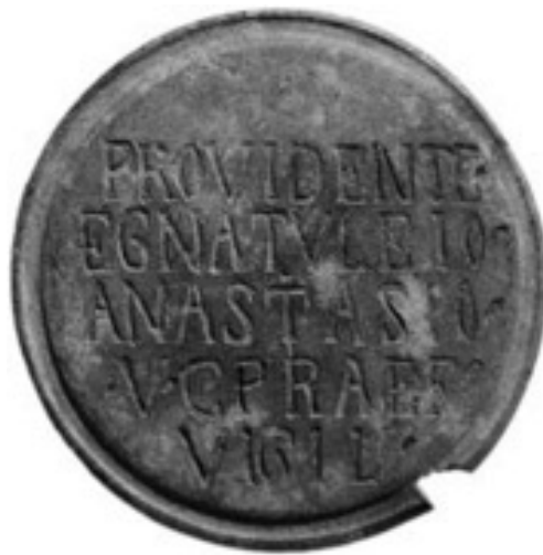
Abb. 2 - Bronzescheibe mit spätrömischer Inschrift aus Siddai-Dorgali (aus: DELUSSU, IBBA 2012, Abb. 2, S. 2197).