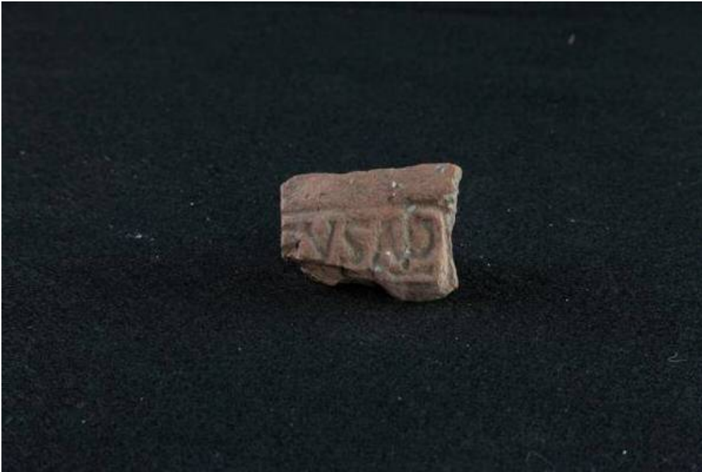
Abb. 2 - Embra-Fragment mit rechteckigem Siegel [EVSAP], gefunden im Gigantengrab von Thomes-Dorgali.

Die Nutzung des Grabs im frühen Mittelalter könnte auf die Nähe der beiden mittelalterlichen Orte Nurule und Isarle zurückzuführen sein (Abb. 3).