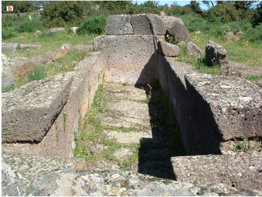
Abb. 3 - Gigantengrab Iloi 2-Sedilo.