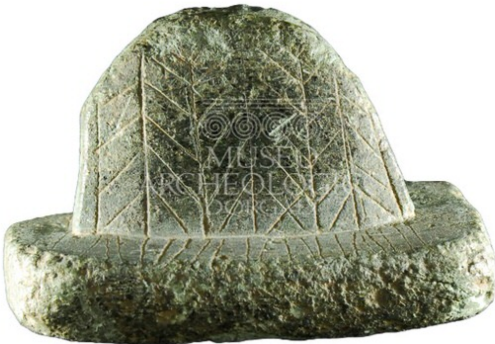
Abb. 1 - Glättstein

Ein Glättstein aus Steatit wurde in den 30er Jahren des vergangenen Jahrhunderts von Antonio Taramelli im kleinen Nuraghendorf Isportana gefunden, dessen Überreste sich südöstlich von Dorgali befinden, zusammen mit Keramikfragmenten, Gewichten und Elementen einer Halskette aus Glaspaste.