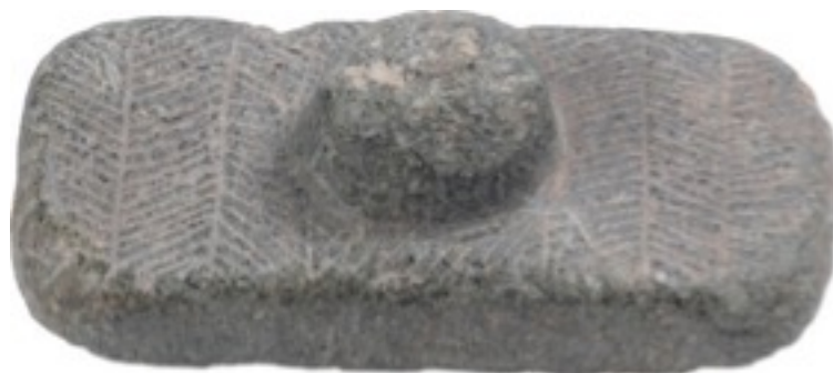
Abb. 3 - Glättstein aus der Nuraghe Santu Antine di Torralba (aus: CASTIA 2014, S. 270).

Die Kategorie der Glättstein gehört zu den Gegenständen des täglichen Gebrauchs und wurden wahrscheinlich zur Bearbeitung von Keramik und Fellen verwendet; oft weisen sie ein Fischgrätdekor auf (Abb. 3) und sind mit einem einfachen Griff versehen, der in einigen Fällen die Form einer kleinen Nuraghe aufweist (Abb. 4).