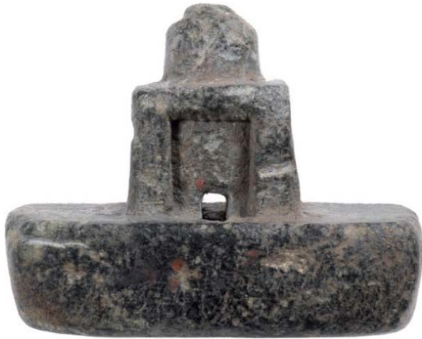
Abb. 4 - Glättstein mit Darstellung einer Vierpass-Nuraghe aus der Nuraghe Santu Antine di Torralba (aus: CASTIA 2014, S. 271).