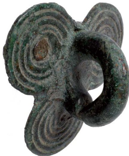
Abb. 4 - Ansatz des Kessels aus Bronze mit dreifacher Spirale, gefunden im Nuraghenkomplex Sa Sedda 'e Sos Carros di Oliena-Nu (aus: Salis 2014, S. 342).

Ein Ansatz mit dreifacher Spirale (fig. 4), der zu einem Kessel aus Bronze gehört und der chronologisch zwischen dem 12. und 10. Jahrhundert v. Chr. einzuordnen und dem Exemplar aus Dorgali ähnlich ist, wurde im Nuraghenkomplex Sa Sedda 'e Sos Carros - Oliena gefunden.