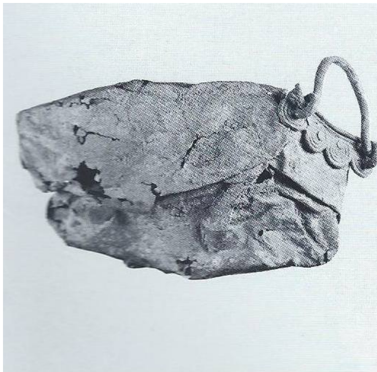
Abb. 3 - Verbeuter Kessel aus dem Nebenraum von San Francesco in Bologna (aus: LO SCHIAVO 1990, S. 250, Abb. 235).

Das Exemplar kann mit einem anderen ähnlichen Kessel aus sardischer Herstellung verglichen werden, der vollständig verbeult im Nebenraum von San Francesco in Bologna gefunden wurde, heute ausgestellt im archäologischen Stadtmuseum von Bologna, der einen identischen Ansatz des Henkel mit 4 Spiralen aufweist (Abb. 3).