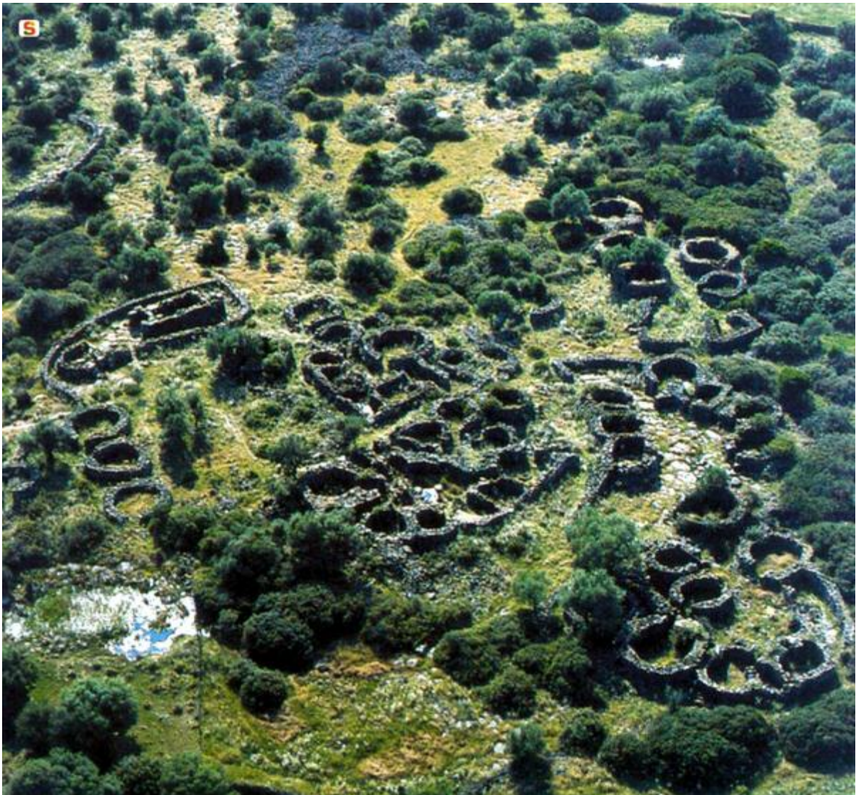
Abb. 1 - Luftbild des Nuraghendorfes Serra Orrios-Dorgali.

Aus dem Nuraghendorf von Serra Orrios im Territorium von Dorgali (Abb. 1,2) stammt eine Doppelaxt (Abb. 3), ein Werkzeug aus Bronzelegierung, das für die Bearbeitung von Holz verwendet wurde.