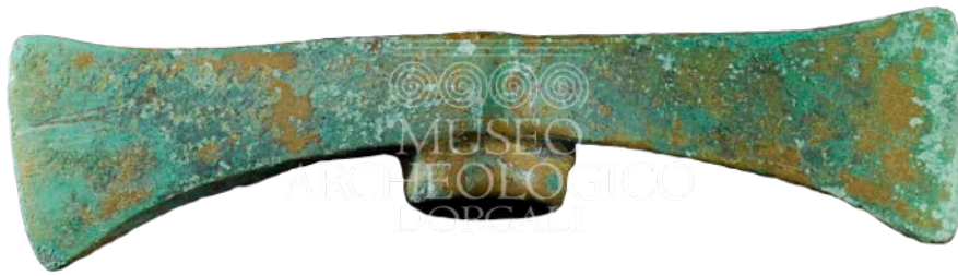
Abb. 3 - Doppelaxt aus Bronze aus Serra Orrios-Dorgali