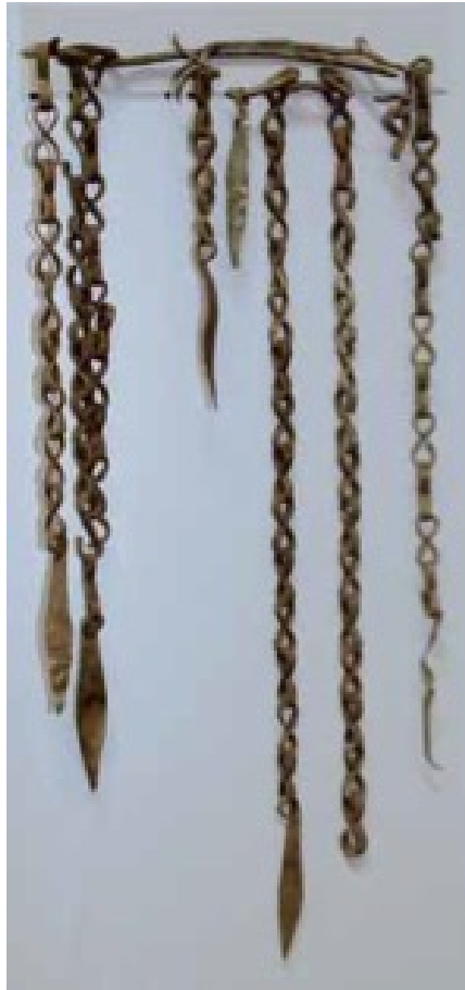
Abb. 5 - Halskette aus Bronze mit Kettchen, die in blattförmigen Elementen enden, aus der Nuraghe Sanu-Taccu di Osini, ausgestellt im speläo-archäologischen Museum von Nuoro (aus: FADDA 2006, Abb. 65, S. 62).

Auch die Interpretation der Funktion dieser Objekte ist kontrovers: Die Mehrzahl der Forscher 5 interpretiert sie jedoch als Schmuckstücke.