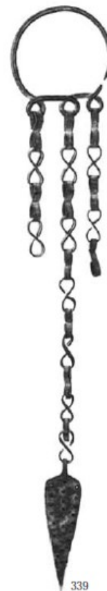
Abb. 4 - Anhänger mit Kettchen, die in lanzenförmigen Elementen enden - Archäologisches Museum von Sassari, vormals Sammlung Dessi (aus: LILLIU 1966, Nr. 339, S. 448).