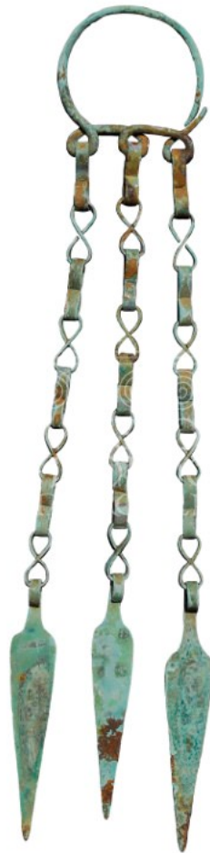
Abb. 1 - Anhänger aus Tillai-Dorgali

In der Fundstätte Tillai 1 im Territorium von Dorgali wurde ein Anhänger 2 aus Bronze gefunden (Abb. 1), der zurzeit im Archäologischen Museum von Dorgali ausgestellt wird, zusammen mit ähnlichen aus der gleichen Ortschaft.