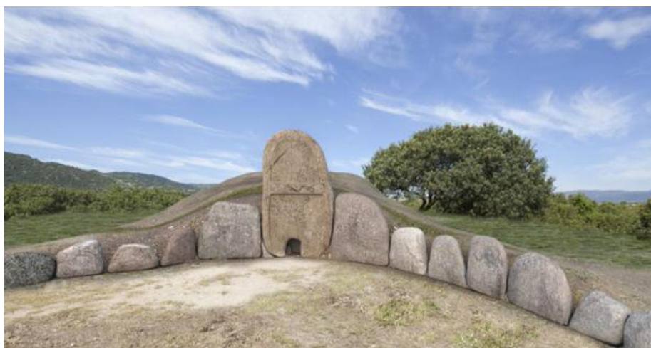
Abb. 2 - Rendering des Raums der Exedra des Gigantengrabs von Thomes, Dorgali.