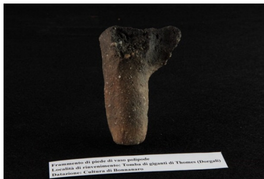
Abb. 1 - Fuß einer mehrfüßigen Vase aus dem Gigantengrab Thomes-Dorgali (Foto von Unicity S.p.A.).

Von der Vase ist nur ein zylindrischer Fuß erhalten (Abmessungen: Höhe 10,3 cm; max. Durchmesser 3,7 cm), mit geraden Ende, sowie ein Teil des Ansatzes, auf dem die Vase saß, deren Form nicht mehr bestimmt werden kann (Abb. 1, 2).