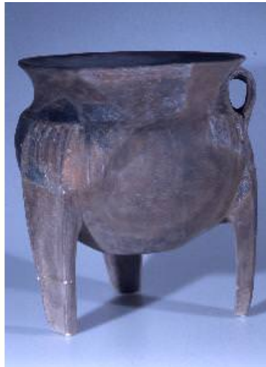
Abb. 3 - Tripode der Monte-Claro-Kultur, ausgestellt im Nationalmuseum G. Sanna in Sassari, aus Su Crocifissu Mannu-Porto Torres.

Die dreifüßigen Vasen entsprechen einer Keramikform mit unterschiedlicher Größe, die zum Garen von Speisen in direktem Kontakt mit dem Feuer diente. Sie waren in allen sardischen prähistorischen Kulturen verbreitet, vom mittleren Neolithikum bis zur alten Bronzezeit, um dann in den nachfolgenden Perioden zu verschwinden (Abb. 3,4).