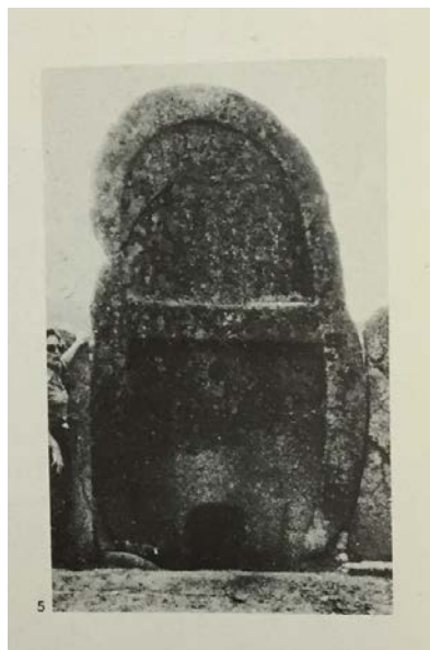
Abb. 9 - Die Stele von Thomes unmittelbar nach der Restaurierung (aus: ontu 1978, Tafel II.5).

Im gleichen Jahr dokumentiert auch Ercole Contu im Artikel Il significato della "stele" nelle tombe di giganti 7 fotografisch die Restaurierung der Stele von Thomes (Abb. 9).