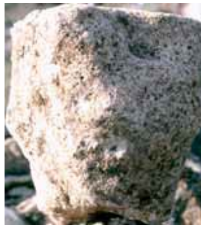
Abb. 1, 2 - Das Modell einer Nuraghe, gefunden im Megaron -Tempel A (aus: Fadda 2012, Abb. 15-16, Ss. 13-15).