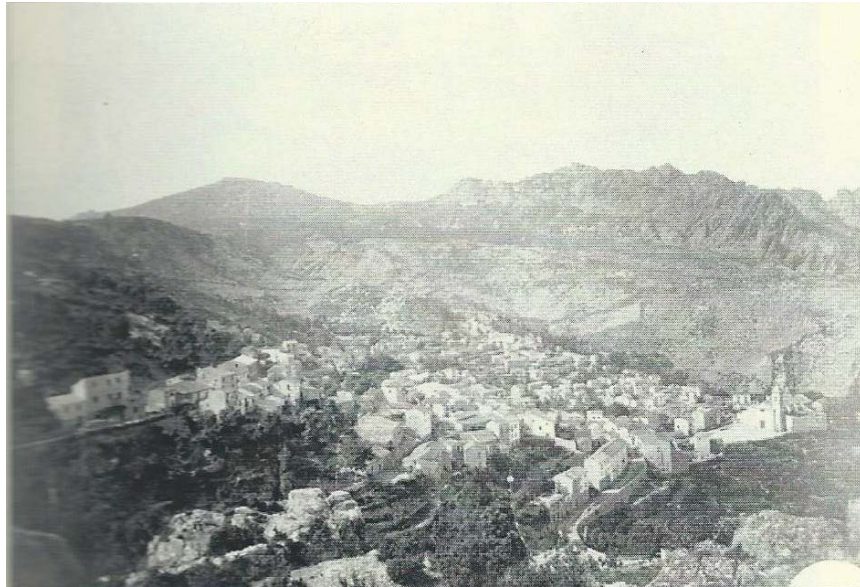
Abb. 3 - Panorama des Dorfs aus den 50er Jahren des vergangenen Jahrhunderts (aus: E. Cannas und D. Casari 2014, Foto 1).

Angius berichtet im Eintrag Villagrande Estrisali , dass diese Gemeinde in den ersten Jahrzehnten des 19. Jahrhunderts aus 225 Häusern; 263 Familien und 1114 Bewohnern bestand, überwiegend konzentriert im vorgenannten Ortsteil, wie aus den ersten Karten des Dorfes hervorgeht, die sich im Archiv des Real Corpo di Stato Maggiore (Archiv La Marmora) von 1840-1845 befinden (Abb. 3).