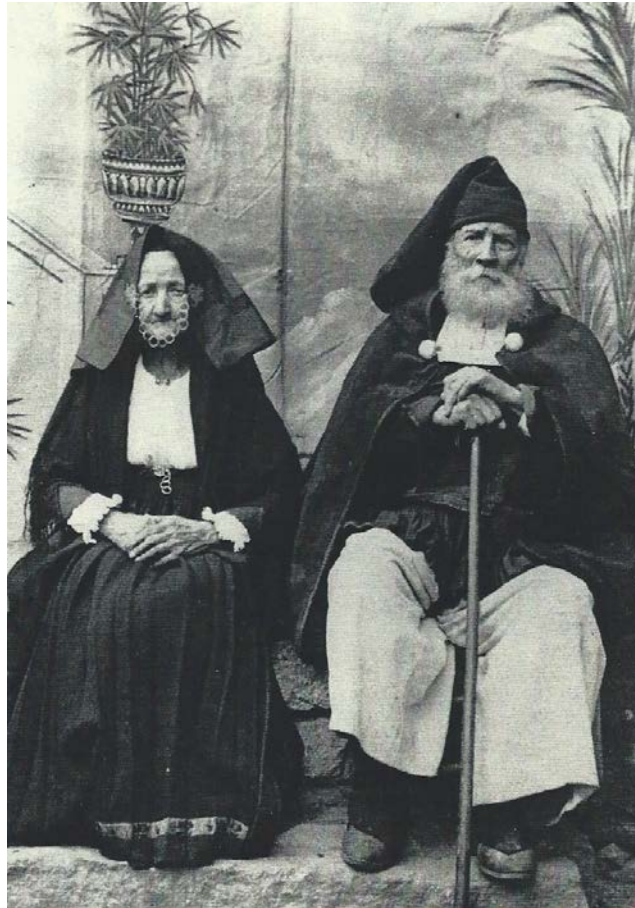
Abb. 4 - Bild vom Ende des 19. Jahrhunderts (aus: E. Cannas und D. Casari 2014, Foto 175).