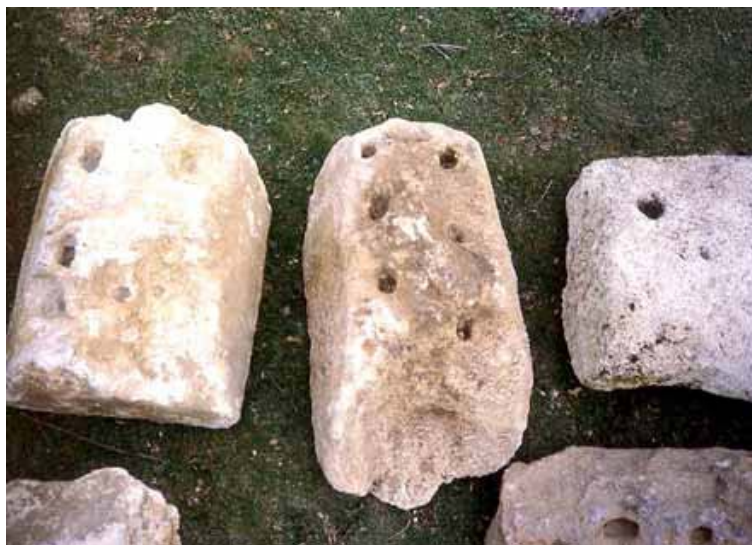
Abb. 3 - Die Basen für die Opfergaben mit Löchern für die Befestigung der Votivgaben aus Bronze (aus: FADDA 2012, S. 18, Abb. 22).

Die große Meisterschaft bei der Bearbeitung des Kalksteins geht hingegen aus den Dekorelementen der Kultstätte hervor: Es wurden zum Beispiel Basen mit Löchern gefunden, die zur Befestigung von Votivgaben aus Bronze dienten (Abb. 3).