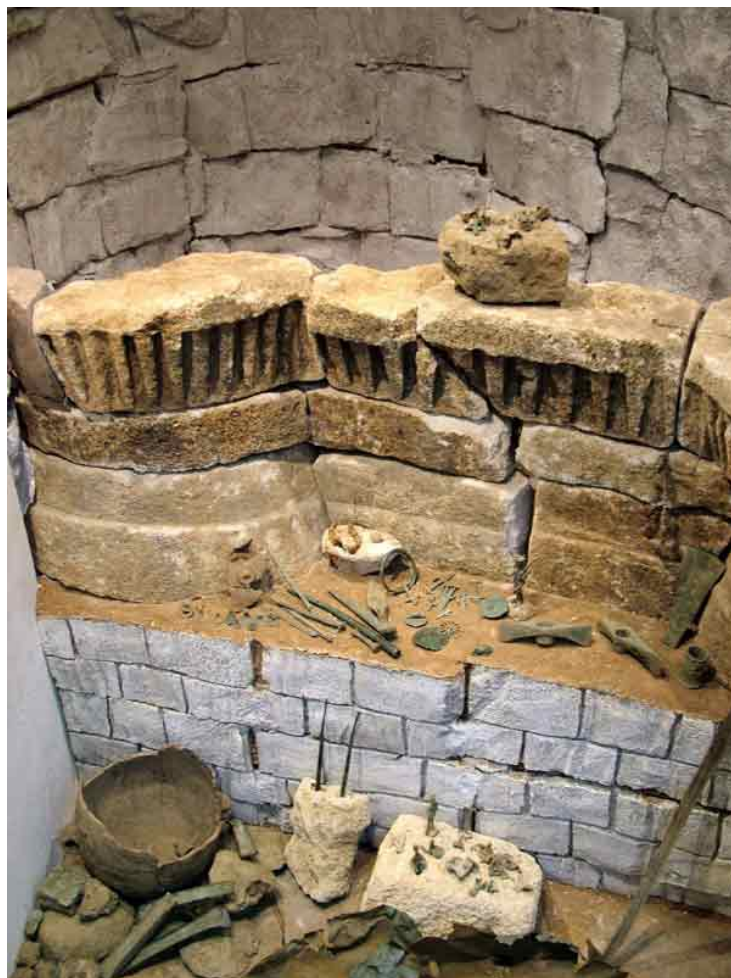
Abb. 2 - Rekonstruktion der Votivgaben des Tempels von Sa Carcaredda (von http://www.museoarcheologiconuoro.beniculturali.it/index.php?it/23/i-reperti/27/diorama-di-sa-carcaredda ).

Im Inneren der runden Zelle mit sakralem Charakter befanden sich eine rituelle Feuerstelle, eingefasst von einer Mauer aus kleinen Kalksteinblöcken, bedeckt mit einer Schicht aus Ton, sowie ein Votivaltar für Opfergaben mit der Form eines Nuraghenturms, auf einem Unterbau aus Kalksteinblöcken, verbunden mit T-förmigen Klammern aus gegossenem Blei (Abb. 2).