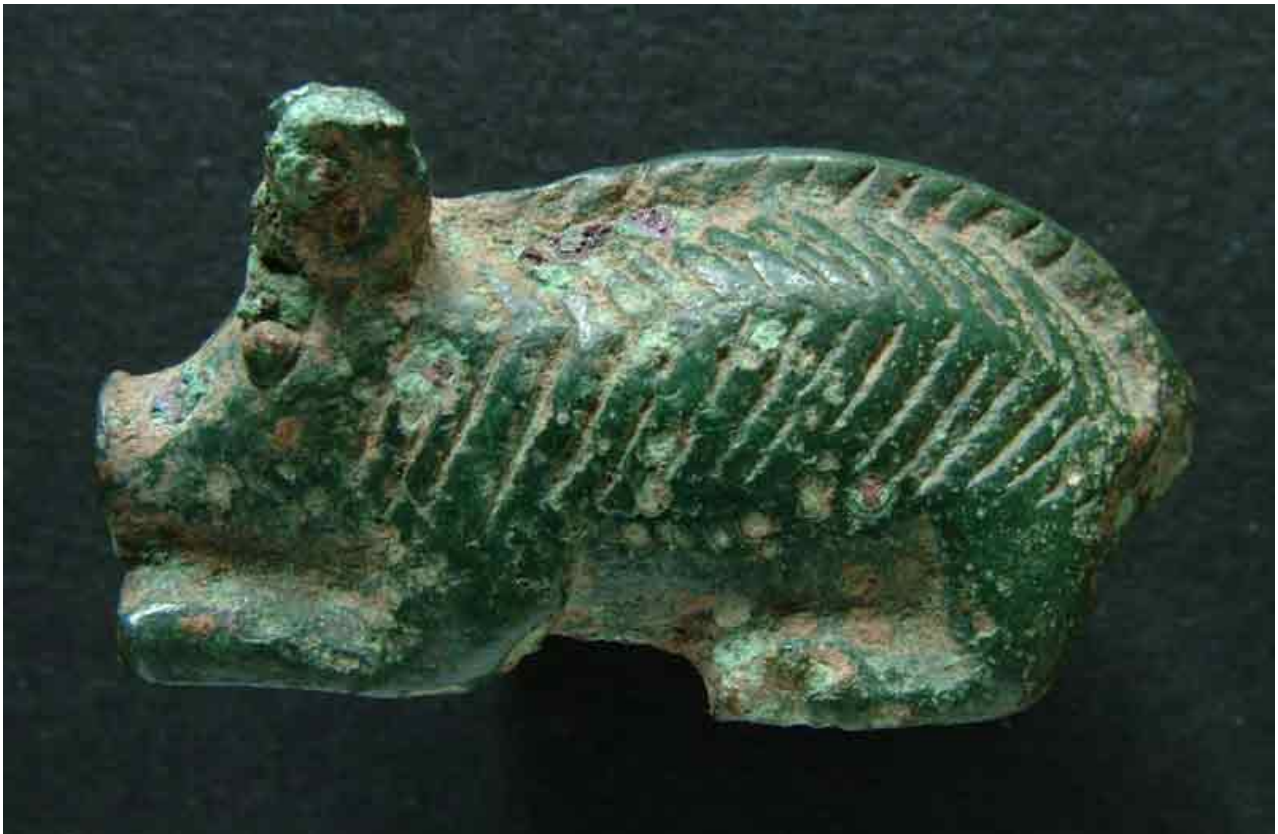
Fig. 3 - Zoomorphe Statuette mit Form eines Wildschweins, aus den Votivgaben von Sa Carcaredda.

Bei den Grabungsarbeiten im Nuraghenkomplex wurden rituelle Objekte wie Knöpfe aus Bronze mit zoomorphen Motiven, Stilette und Köcher als Votivgaben, Bronzefiguren (Opfernde und Tiere), Dolche, Speerspitzen, Äxte sowie Elemente einer Halskette aus Bernstein und Bergkristall gefunden, die auf den Zeitraum zwischen dem 12. und dem 7. Jahrhundert v. Chr. datiert werden können. (Abb. 3).