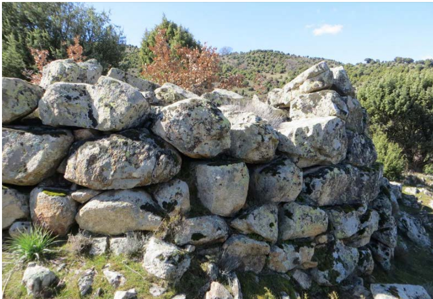
Abb. 2 - Nuraghe Lalzoracesus oder Lotzoracesa

Die archäologischen Daten bieten heute ein selektives und fragmentarisches Bild; die Überreste von Nuraghen (Abb. 2) und des Gigantengrabs (Abb. 3) sind wertvolle archäologische Zeugnisse, die die Hypothese gestatten, dass hier Mensch dauerhaft an den wegen der Wanderviehzucht siedelten.