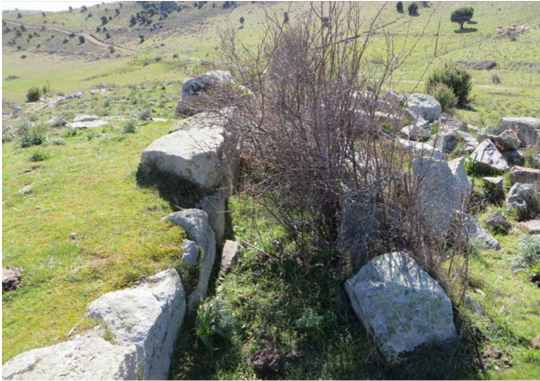
Abb. 3 - Gigantengrab bei der Nuraghe Lalzoracesus oder Lotzoracesa.