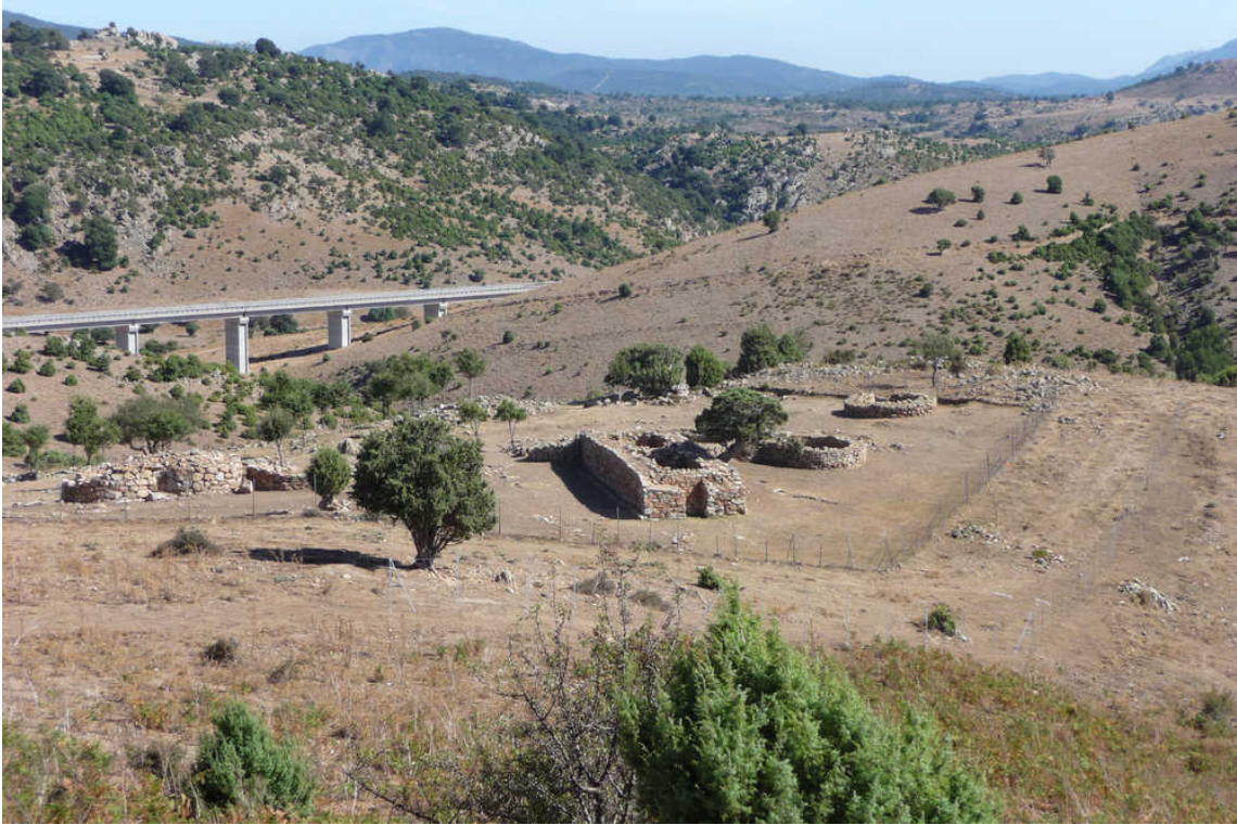
Abb. 3 - Panoramabild der Fundstätte.

Bei den Grabungsarbeiten am ersten Megaron -Tempel, die in den 80er und 90er Jahren des vergangenen Jahrhunderts durchgeführt wurden, um die Plünderung durch wilde Grabungen zu beenden, wurde der Schwerpunkt auf die Bedeutung der Fundstätte, die Feststellung des Typs, der Ausdehnung und der Konsistenz der Tempelanlage sowie die verschiedenen Phasen der Nutzung und die wahrscheinlichen Beziehungen zum zugehörigen Agglomerat gelegt und dabei wurde vor allem durch den materiellen Kontext belegt, dass er auf einer vorausgehenden Wohnsiedlung errichtet wurde. In den Jahren 2007-2011 wurden bei weiteren Grabungskampagnen zwei weitere Tempelbauwerke gefunden, darunter der Megaron 2 , in dessen Inneren sich im hinteren Raum mit Apsis ein besonderer Altar befindet, errichtet aus behauenen Blöcken aus Vulkangestein sowie mit Prospekt, verziert mit zwei Widderprotomen im Hochrelief, sowie mit einer rituellen Feuerstelle, bestehend aus verschiedenen Basaltblöcken, die die Krönung eines Nuraghenturms imitieren.