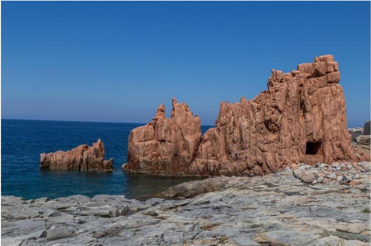
Abb. 2 - Die roten Felsen.