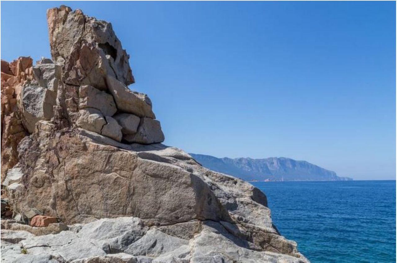
Abb. 4 - Eine Panorama-Ansicht der Ogliastro-Küste, gesehen von den roten Felsen (Foto von Unicity S.p.A).