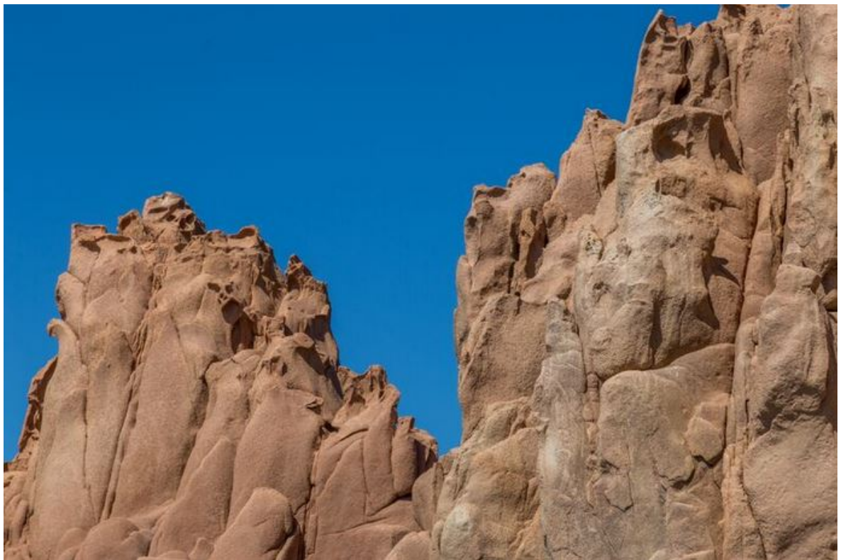
Abb. 3 - Detail der Zinnen.