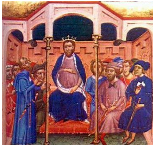
Abb. 3 - Jakob II. von Aragon