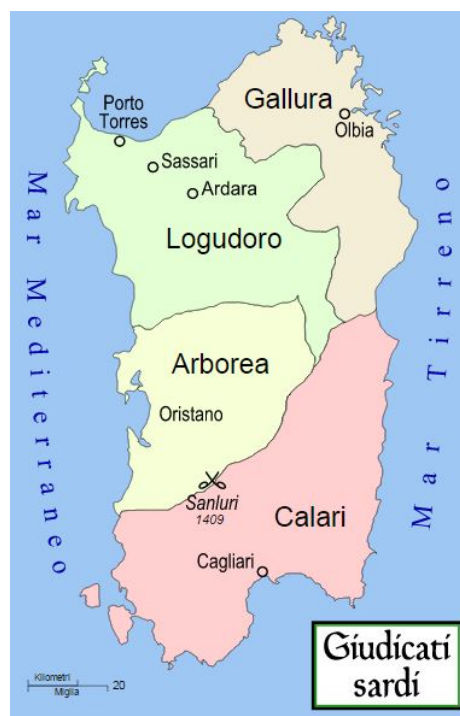
Abb. 1 - Die sardischen Judikate vom 11. bis zum 14. Jahrhundert

Sardinien entfernte sich während des 13. und 14. Jahrhunderts nach und nach von Byzanz, was zur Entstehung von 4 Verwaltungsbezirken führte, die von einem Iudex regiert wurde, der sowohl die politische, als auch die militärische Macht ausübte. Auf diese Weise entstanden die Judikate Cagliari, Torres, Arborea und Gallura (Abb. 1).