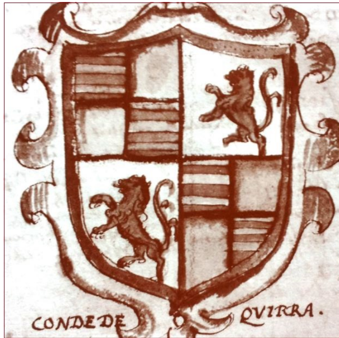
Abb. 4 - Das Wappen der Carroz, Herzöge von Quirra (aus: FLORIS 1997, S. 349).

Im Jahr 1403 eroberten die iberischen Truppen nach dem Tod der Giudicessa Eleonora d'Arborea, die gesamte Insel und so begann für die Sarden eine lange Periode der Ausbeutung, der Hungersnöte und der gesellschaftlichen und politischen Krisen.