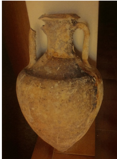
Abb. 3 - Amphore aus dem von Arbatax (aus: A.A.V.V. 2005, S. 73).