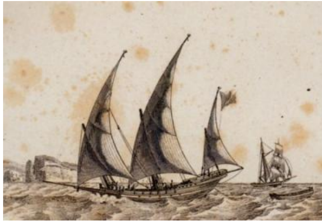
Abb. 4 - Feluke (aus: BAUGEAN 1817).