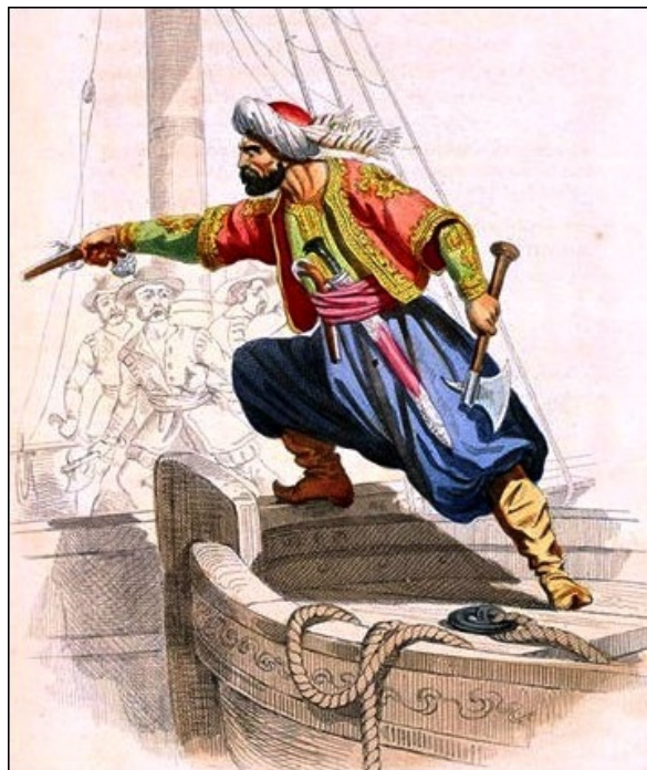
Abb. 1 - Korsar (aus: AA.VV. 2014).

Im Mittelmeerraum fanden bereits seit dem 8. Jahrhundert Überfälle der Araber (auch Sarazenen genannt) statt, das Phänomen wurde jedoch im 16. Jahrhundert durch die Ausweitung der ottomanischen Macht im westlichen Mittelmeerraum besonders drückend.