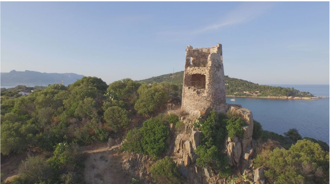
Abb. 4 - Der Turm San Gemiliano, gesehen von Südosten.