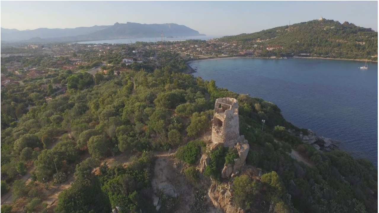
Abb. 3 - Im Vordergrund der Turm von S. Gemiliano; oben rechts der Leuchtturm von Capo Bellavista (Foto von Unicity S.p.A.).