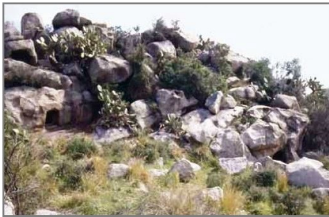
Abb. 1 - Unterirdische Nekropole von Monte Terli. Die isolierten Felsblöcke, in die die einzelligen domus de janas gegraben sind (aus: FADDA 2012, S. 13, Abb. 12)).

Die unterirdische Nekropole von Monte Terli umfasst 8 domus de janas: 4 sind in isolierte Felsblöcke auf der Westseite gegraben und 4 in eine schwierig zugängliche Wand (Abb. 1-4).