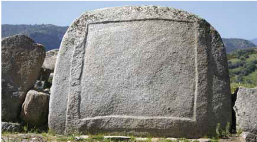
Abb. 3 - Unterer Teil der Stele mit Relieffries (aus: FADDA 2012, S. 29, Abb. 37).

Das zweite Grab befindet sich an der Basis des Hügels von S'Ortali 'e Su Monte. Es wird als das Gigantengrab von Pala Niedda bezeichnet und befindet sich zurzeit auf einem Privatgrundstück. Es ist 12 Meter lang und weist eine Reihe der Außenmauer auf, bestehend aus Granitblöcken sowie Exedra mit leicht gebogenen Flügeln. Es wurde noch nicht von Archäologen erforscht und da Überreste der materiellen Kultur fehlen, kann nicht festgestellt werden, ob das Monument aus der gleichen Zeit wie die Nuraghe und das andere Grab stammt.