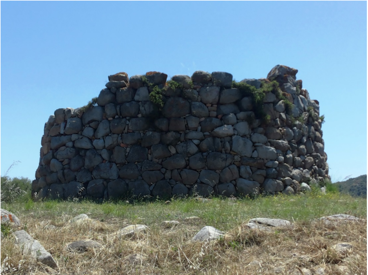
Abb. 3 - Die Nuraghe von S'ortali 'e su Monte, gesehen von Norden.

Der Zugang zum Turm führt zu einem Korridor, an dessen linker Seite noch die Überreste der Treppe sichtbar sind, die zur Terrasse der Nuraghe führt. Durch diesen kurzen Gang gelangt in die runde Kammer, ursprünglich mit Tholos-Gewölbe, wo in der Stärke der Mauer drei große Nischen angelegt wurden (Abb. 4). Vor Kurzem haben archäologische Grabungsarbeiten, die im Inneren der Kammer durchgeführt wurden, belegt, dass das Monument auch in den nachfolgenden spätpunischen und römischen Phasen genutzt wurde, während es im frühen Mittelalter, als es bereits seine Wohnfunktion verloren hatte, als Begräbnisstätte genutzt wurde.