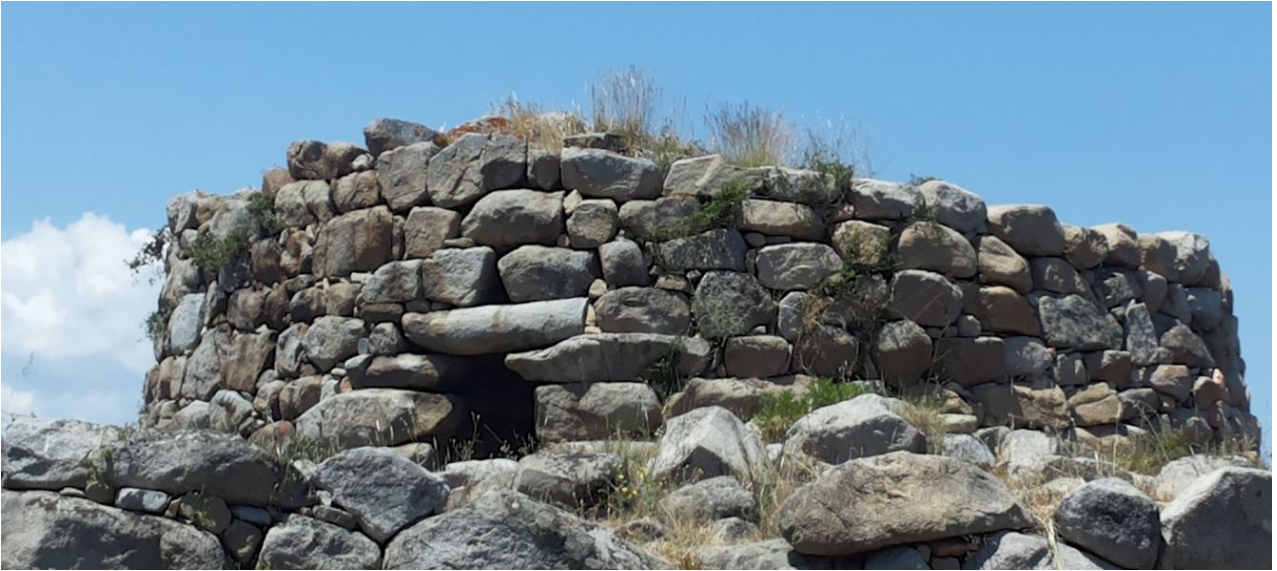
Abb. 2 - Nuraghe di S'ortali 'e su Monte: Details des Eingangs mit dem Menhir, der als Architrav wiederverwendet wurde.

Der zentrale Turm, der nur zum Teil mit einer Höhe von 4,26 Metern erhalten ist, weist einen nach Süden ausgerichteten Eingang auf und verwendet als Architrav ein Teil eines Menhirs aus der pränuraghischen Periode (Abb. 2-3).