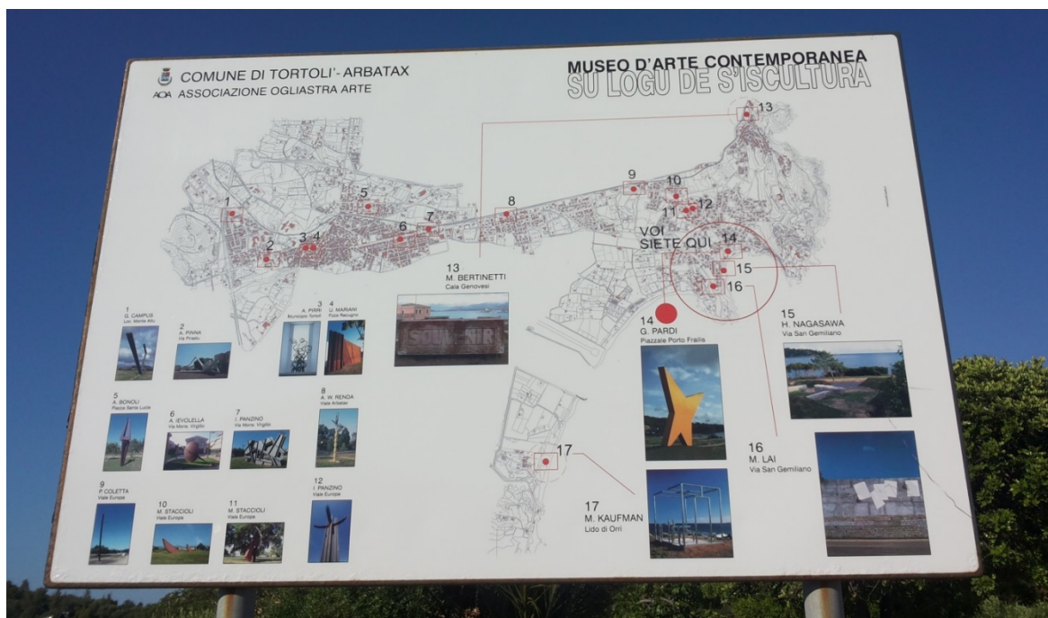
Abb. 1 - Illustrationstafel mit Angabe der Lage der Skulpturen.

Zu sehen sind Werke von Maria Lai (Abb. 2), Giovanni Campus (Abb. 3), Massimo Kaufmann (Abb. 4), Mauro Staccioli (Abb. 5), Antonio Levolella, Umberto Mariani (Abb. 6), Ascanio Renda, Iginò Panzino, Alex Pinna (Abb. 7), Hitetoski Nagasawa, G. Pardi (Abb. 8).