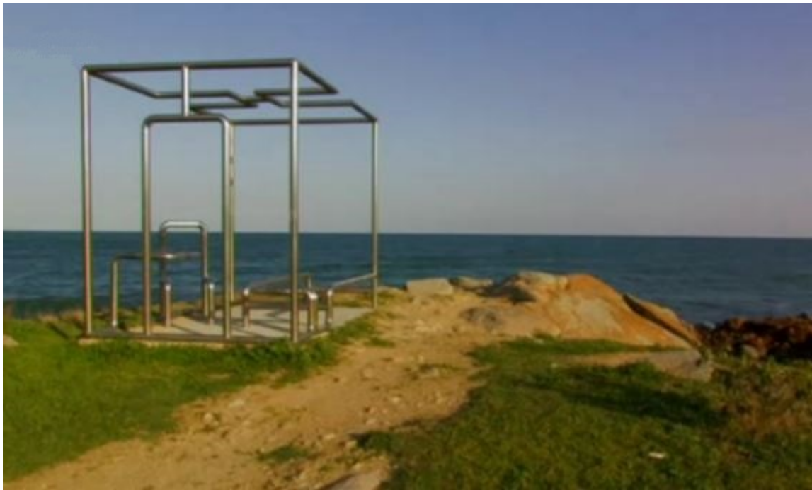
Abb. 4 - Lido di Orrì: Cella Osservatorio di Stella , von Massimo Kaufmann (von http://www.sardegna-digital-library.it/index.php?xsl=626&s=17&v=9&c=4460&id=555748 ).