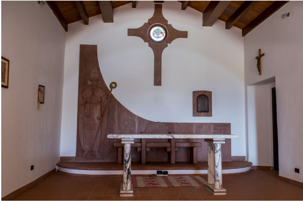
Abb. 4 - Das Innere der Kirche.

Die Statue des San Gemiliano wird in der Kirche Sant'Andrea in Tortoli aufbewahrt und nur anlässlich des Fests des Heiligen zur Feldkirche gebracht (Abb. 5).