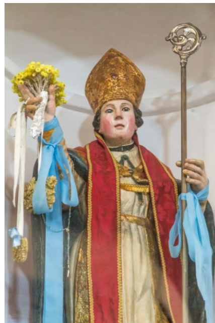
Abb. 5 - Die Statue des San Gemiliano, aufbewahrt in der Kirche Sant'Andrea in Tortoli (Foto Unicity S.p.A.).

Die Statue des San Gemiliano wird in der Kirche Sant'Andrea in Tortoli aufbewahrt und nur anlässlich des Fests des Heiligen zur Feldkirche gebracht (Abb. 5).