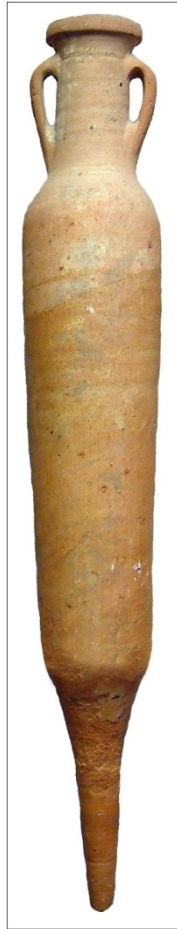
Abb. 2 - Spatheion, Museo Nacional de Arqueología Marítima, Karthago (von http://archaeologydataservice.ac.uk/archives/view/amphora_ahrb_2005/zoom.cfm?id=289&img=PEC311&CFID=53918&CFTOKEN=1E0239C2-B493-4C48-AB6AC779E10D52E4 ).