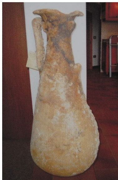
Abb. 1 – Amphore Beltrand II B, geborgen aus dem Meer von Arbatax (aus: SALVI ET ALII 2005, S. 81).

Sie weist einen gestreckten birnenförmigen Körper auf, der sich an der Basis stark verbreitert; schlanker Hals ohne Ansatz an der Schulter sowie nach außen gebogener Rand mit großer Öffnung; Bandhenkel; hohe Spitze (Abb. 2-3). Dieser Behältertyp wurde in der Betica produziert. Die mittlere Höhe beträgt bei intakten Exemplaren 100-110 cm (Abb. 4). Der Typ wurde von Beginn des 1. Jahrhunderts n. Chr. Bis Mitte des 2. Jahrhunderts im gesamten Mittelmeerraum produziert. Er wurde für den Transport von Fischsoße (Muria) verwendet.