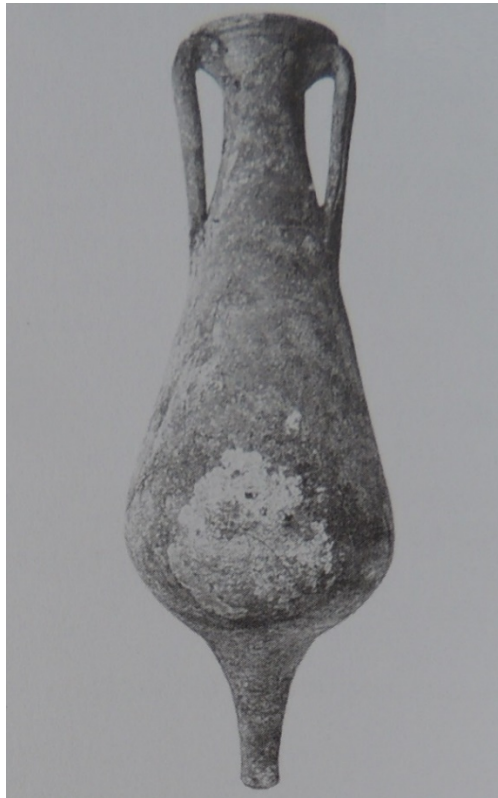
Abb. 3 - Amphore Beltrand II B (aus: CARVALE, TOFFOLETTI 1998, S. 128).