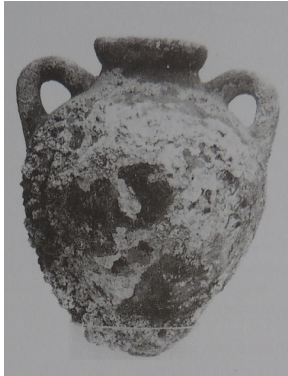
Abb. 4 - Etruskische Amphore vom Typ Py 4A, 5. bis 3. Jahrhundert v. chr. (aus: CARAVALE, TOFFOLETTI 1998, S. 79).