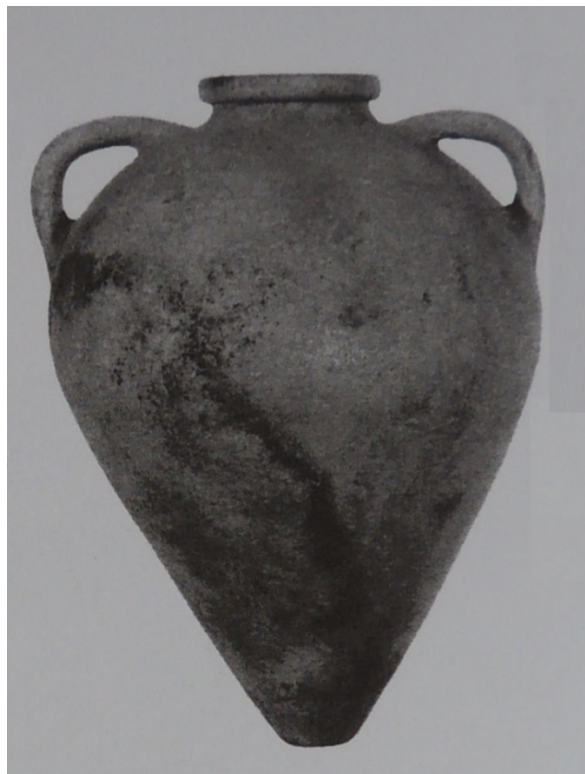
Abb. 3 - Etruskische Amphore vom Typ Py 1/2, 7. bis 6. Jahrhundert v. chr. (aus: CARVALE, TOFFOLETTI 1998, S. 76).