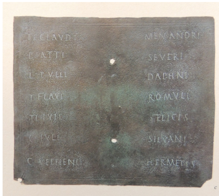
Abb. 3 - Äußeres der Tabelle II mit den Namen der Zeugen (aus: AA.VV. 1989, S. 231, Abb. 16 c).

Auf der Außenseite der Bronzeplatte werden erneuter der gesamte Text der Entlassung und die Namen der 7 Zeugen angegeben: Ti(beri) Claudi Menandi; P(ubli) Atti Severi; L(uci) Pulli Daphni; T(iti) Flavi Romuli; Ti(beri) Iuli Felicis; C(ai) Iuli Silvani; C(ai) Vettieni Hermetis (Abb. 3).