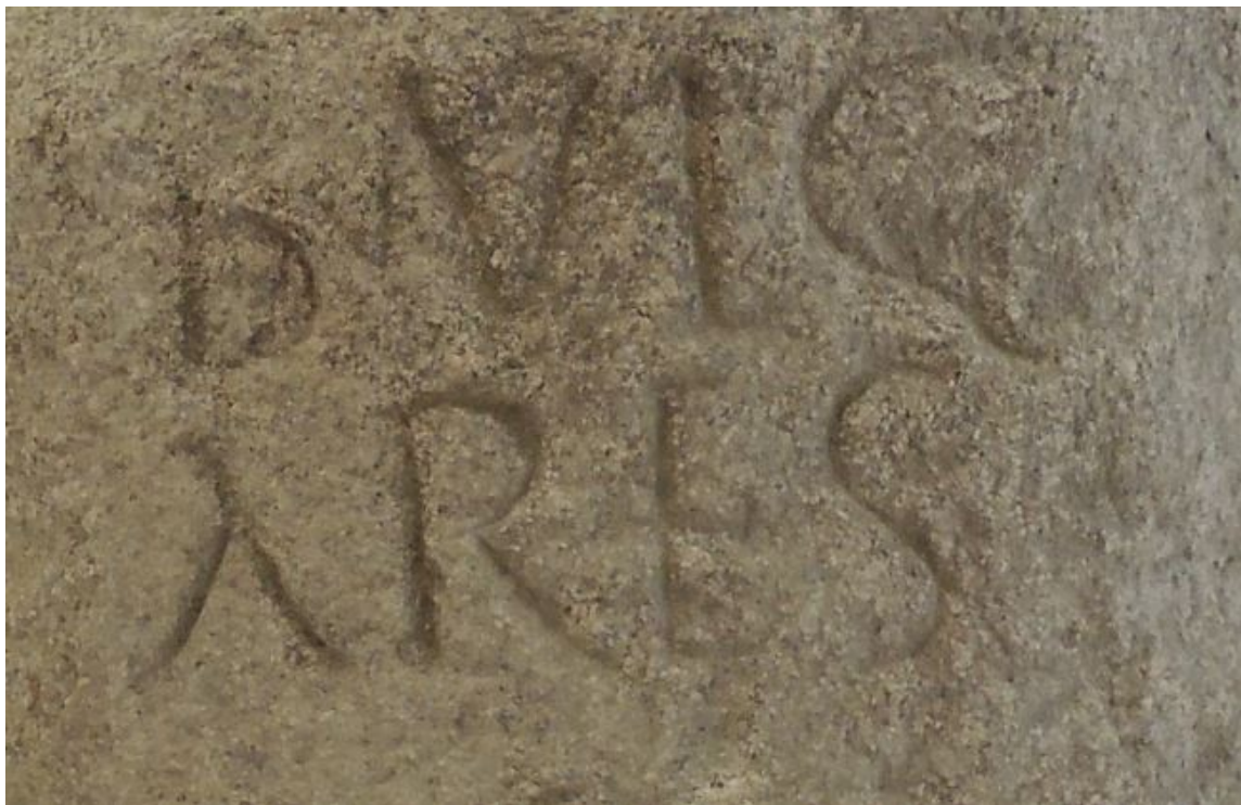
Abb. 4 - Detail der Inschrift B'v'ULG/ARES (Foto von M. G. Arru).