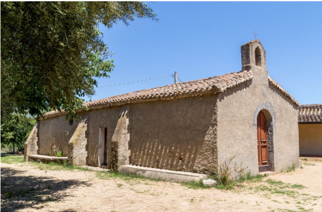
Abb. 1 - Die Kirche San Lussorio, in deren Nähe der Grabstein gefunden wurde

Im Jahr 1976 wurde in der unmittelbaren Nähe der Feldkirche S. Lussorio (Abb. 1) beim Pflügen ein zylindrischer Grabstein aus grauem Granit gefunden, der oben und unten beschädigt ist (Abb. 2).