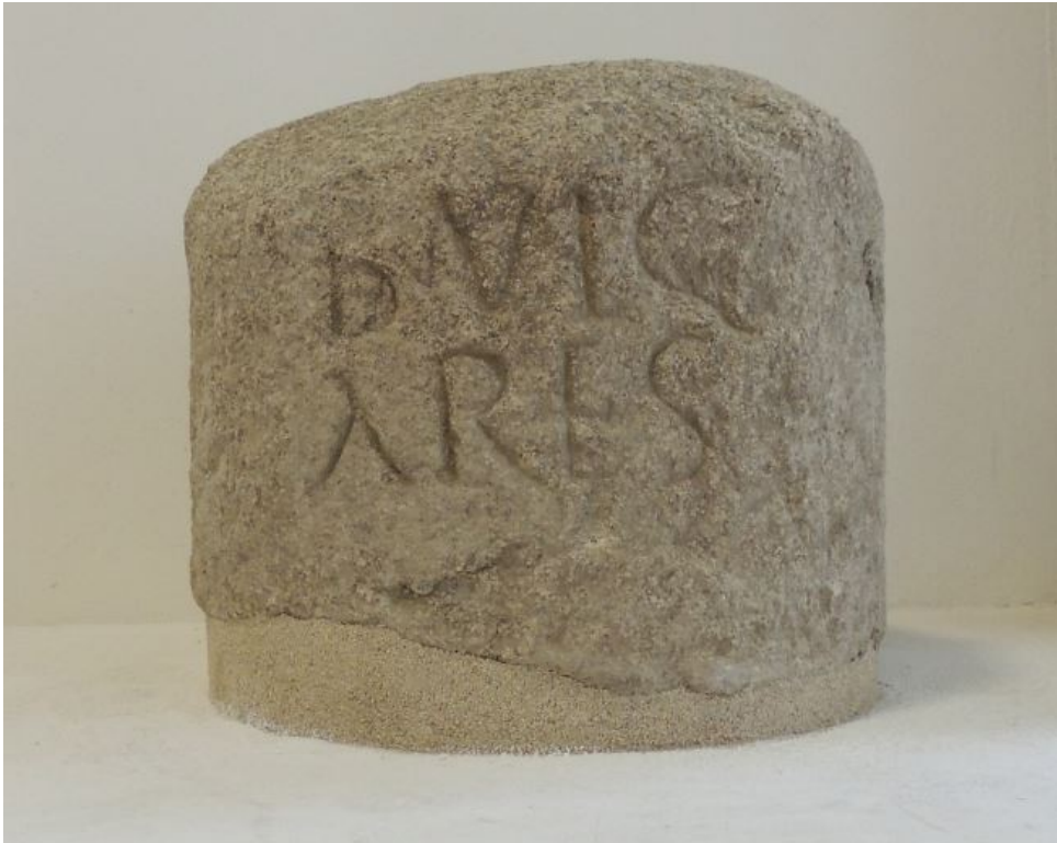
Abb. 3 - Der Grabstein von Tortolì.