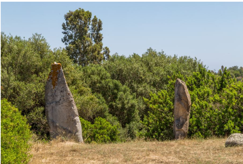
Abb. 3 - Die Menhire vor dem Gigantengrab von S'Ortali 'e su Monte.

Die Nuraghenzeit ist durch zahlreiche Nuraghen belegt, sowohl einfach, als auch mehrlappige, sowie durch einige Gräber, wie die von S'Ortali 'e su Monte (Abb. 4-5).