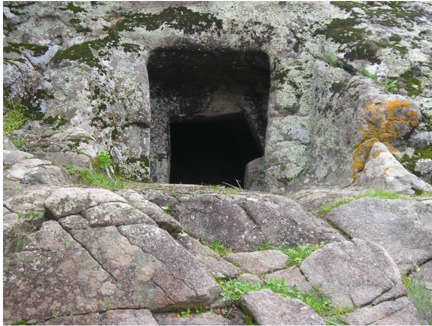
Abb. 2 - Die domus de janas, die am Hügel S'Ortali 'e su Monte ausgegraben wurde (Foto von C. Nieddu).