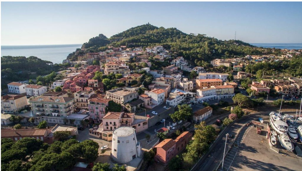
Abb. 7 - Der Turm von S. Miguel und im Hintergrund der Leuchtturm von Bellavista.

Der Turm, der den Hafen beschützte, war mit Kanonen und Steinschleudern ausgestattet und wurde im Laufe der Jahrhunderte oft angegriffen. Im Jahr 1846 verlor das Bauwerk seine Funktion als Aussichts- und Verteidigungsturm und wurde anschließend Kaserne der Finanzpolizei.