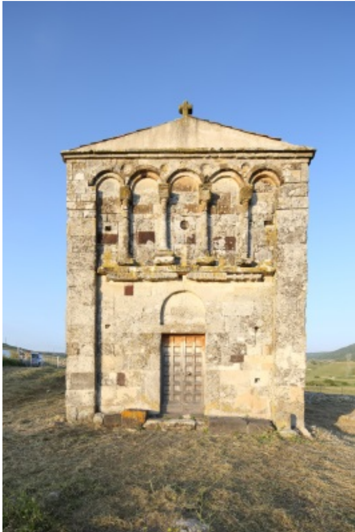
Abb. 3 - Die Kirche San Nicola di Trullas.