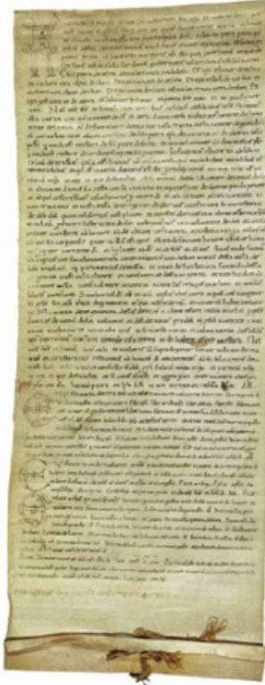
Abb. 1 - Urkunde über die Stiftung der Kirche San Nicola di Trullas, 1113 (Staatsarchiv Florenz).