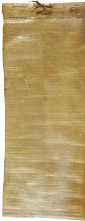
Abb. 2 - Urkunde über die Stiftung der Kirche San Nicola di Trullas, 1113 (Staatsarchiv Florenz).