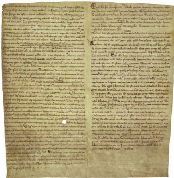
Abb. 3 - Urkunde über die Stiftung der Kirche San Nicola di Trullas, 1113 (Staatsarchiv Florenz).