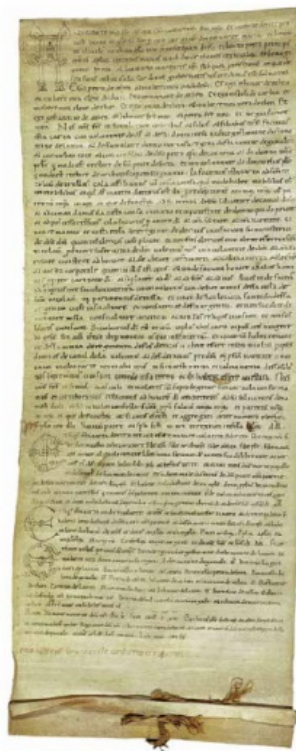
Abb. 1 - Urkunde über die Stiftung der Kirche San Nicola di Trullas, 1113 (Staatsarchiv Florenz).

Die Urkunde über die Stiftung der Kirche San Nicola di Trullas an die Kamadulensermönche ist glücklicherweise erhalten geblieben (Abb. 1-4). Aus der Urkunde wissen wir, dass am 29. Oktober 1113, dreizehn Mitglieder der Familie Athen mit Zustimmung des Giudice und die kirchlichen Behörden Guido, dem Rektor der Kamadulenser, die Kirche San Nicola di Trullas stiftete und sie der Einsiedelei San Salvatore di Camaldoli im toskanischen Apennin unterstellte. Aus der Urkunde wissen wir, dass die Familie Athen den Kamadulensern eine Kirche mit allem stiftete, was für die Durchführung der normalen liturgischen Aktivitäten erforderlich ist: Erwähnt werden ein Altaraufsatz aus Silber, ein Kreuz, ebenfalls aus Silber, verschiedene liturgische Bücher sowie auch Reliquien.