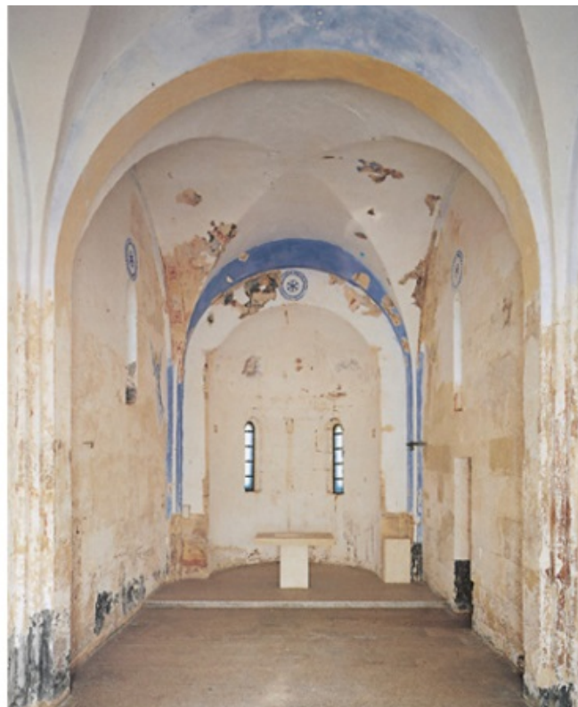
Abb. 3 - Das Innere der Kirche S. Nicola di Trullas vor den Restaurierungsarbeiten des Jahres 1997.

Die Apsis, die Fläche der beiden Kreuzgewölbe, die Seitenwände sowie die Innenseite der Fassade weisen noch Freskenreste auf, die bei den Restaurierungsarbeiten des Jahres 1997 nach der Entfernung der Putzschichten entdeckt wurden, die sie verdeckten (Abb. 3).