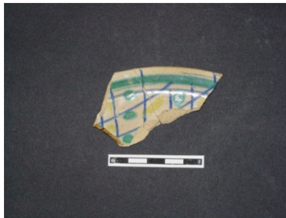
Abb. 10 - Polychrome Majolika, Sassari.

Die Nutzung in moderner und zeitgenössischer Epoche (Mitte des 18. Jahrhunderts bis Anfang des 20. Jahrhunderts) wird durch Keramik des Typs taches noires aus Albisola und Sizilien, Majolika aus dem Latium mit braunem und gelbem Dekor sowie durch Steinzeug aus italienischer Produktion belegt.