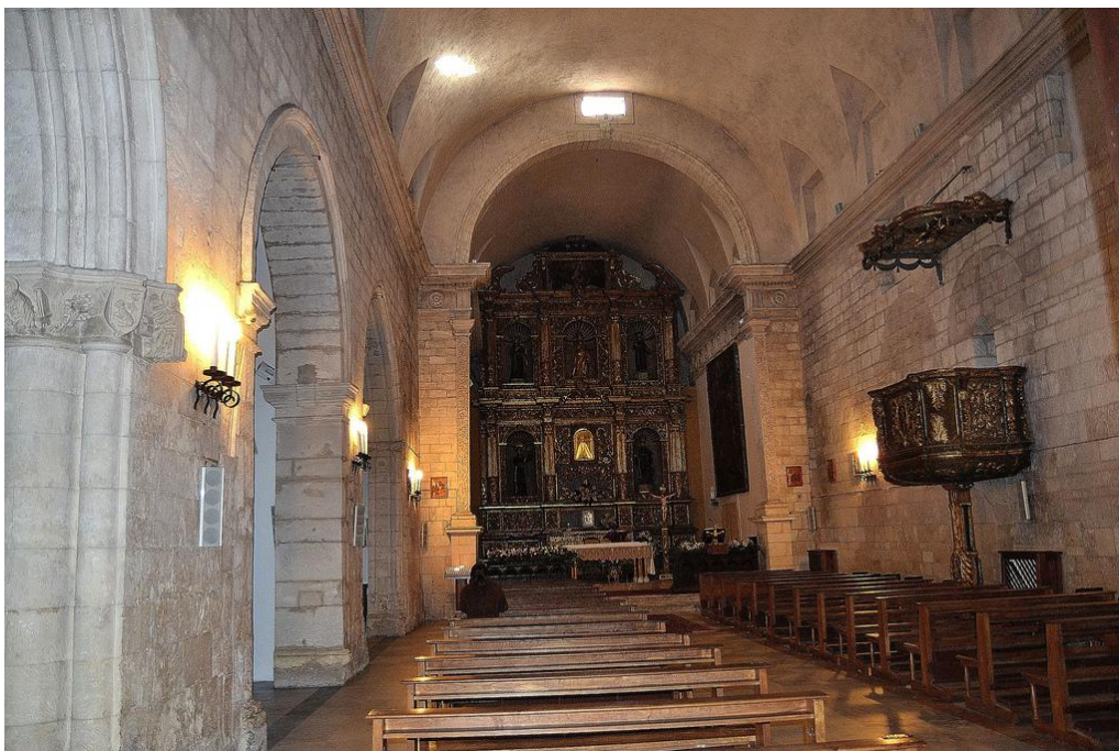
Abb. 4 - Sassari, Kirche San Pietro di Silki: Inneres.