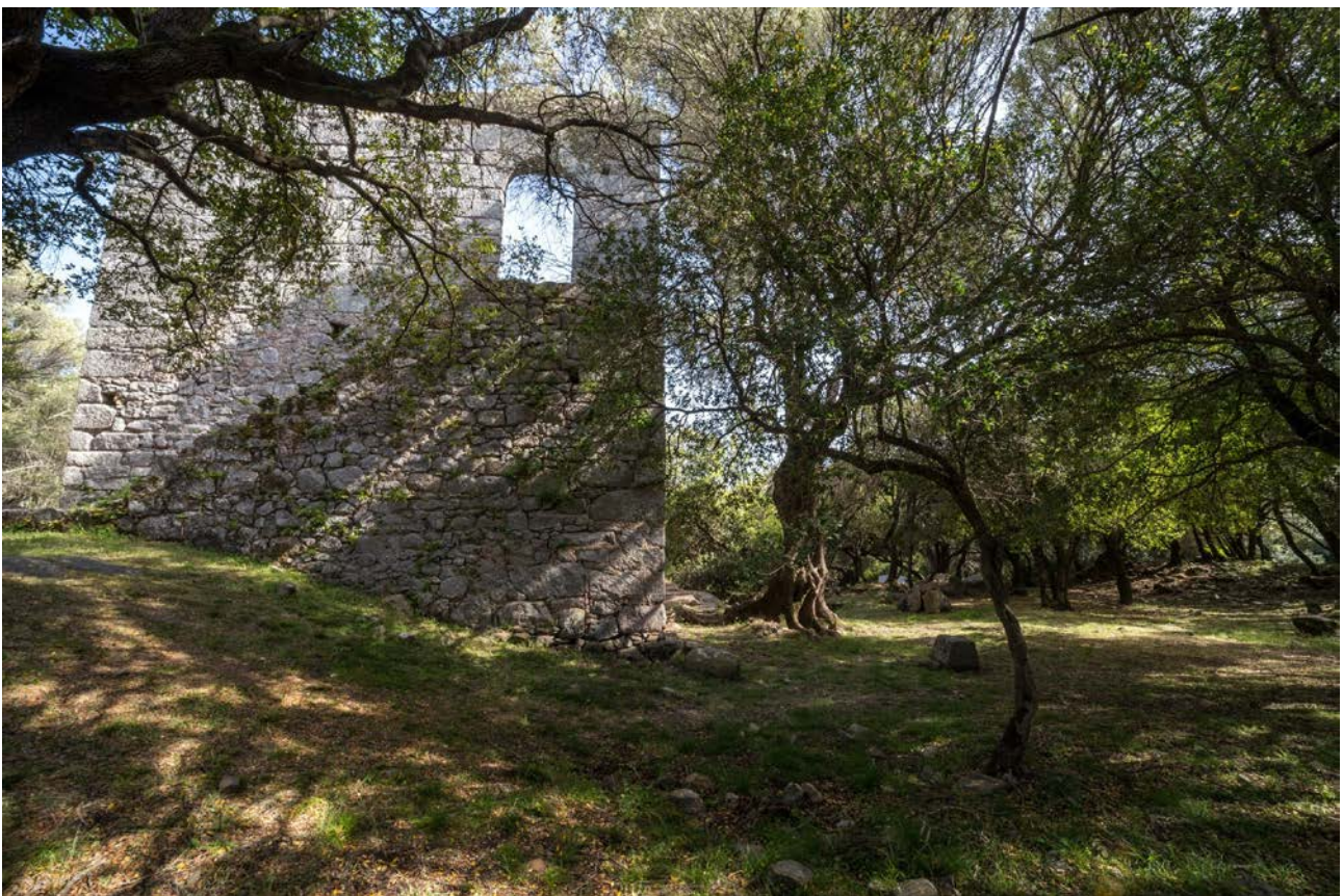
Abb. 1 - Luogosanto, Palazzo di Baldu.

Ubaldo II. Visconti ist die historische Figur, die die Tradition mit dem Palazzo im Territorium von Luogosanto in Zusammenhang bringt und auf die der Name verweisen soll: Sein offizieller Sitz war der Palazzo Giudicale von Civita (heute Olbia), während die Burgen von Baldu (Abb. 1), Balaiana (Luogosanto) und Monteacuto (Berchidda) seine Sommerresidenzen waren.