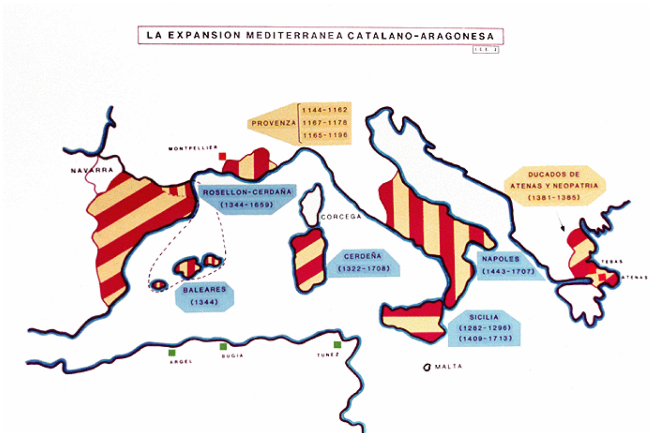
Abb. 1 - Die Expansion der Krone von Aragon.

Die Villa Sent Steva , die Hypothesen zufolge mit dem Palazzo di Baldu in Zusammenhang steht, wurde mit Sicherheit genutzt, als Sardinien sich bereits unter der Herrschaft der Katalanen-Aragoner befand: Das Zentrum wird in einer Erfassung der Erträge erfasst, die die Villen im Besitz der Krone von Aragon (Abb. 1) zum Zeitpunkt der Erstellung zahlten, um das Steueraufkommen aller Besitzungen zu erfassen.