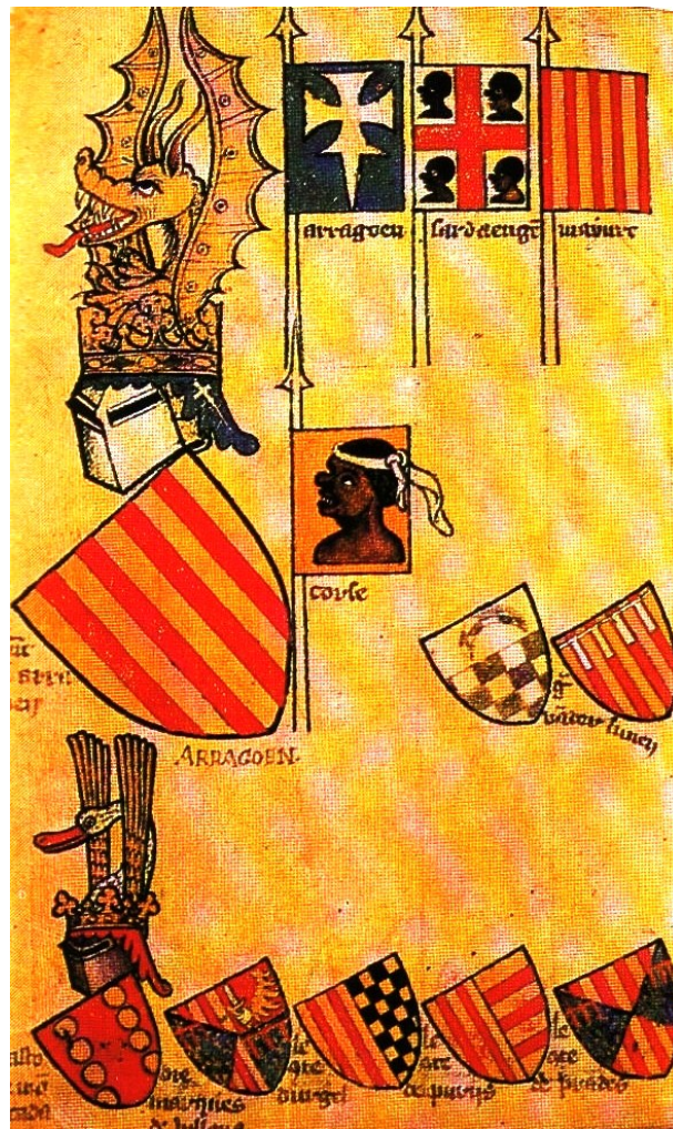
Abb. 3 - Wappen von Gelre: Die Wappen der Staaten der Krone von Aragon (zweite Hälfte des 14. Jahrhunderts), (von: https://it.wikipedia.org/wiki/Corona_d'Aragona#/media/File:Stemmi_degli_stati_della_Corona_d%27Aragona.jpg ).

Die größeren Zentren der Insel wurden zu Königstädten und da sie direkt der zentralen Autorität unterstellt waren, erhielten sie die gleichen Privilegien wie Barcelona. Mehr als ein Jahrhundert lang behinderten das Judikat Arborea (bis zum Jahr 1410) und die bereits vor der Eroberung angesiedelten genuesischen und pisanischen Adelsfamilien die iberische Herrschaft.