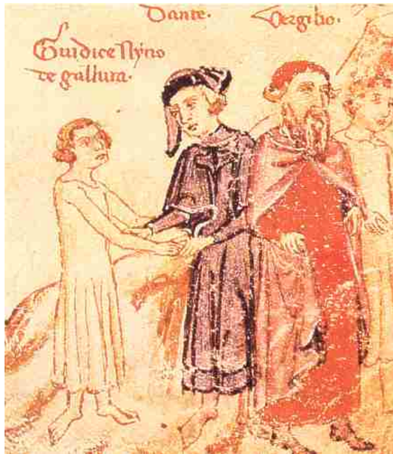
Abb. 4 - Bild aus der Göttlichen Komödie, auf dem das Fegfeuer dargestellt ist (Gesang VIII), wo Dante und Virgil Nino von Gallura treffen.

abwechselnd, die Vorherrschaft über die Insel zu erlangen oder aufrecht zu erhalten, bis es dem Reich Aragon gegen Ende des 14. Jahrhunderts gelang, Sardinien zu erobern.