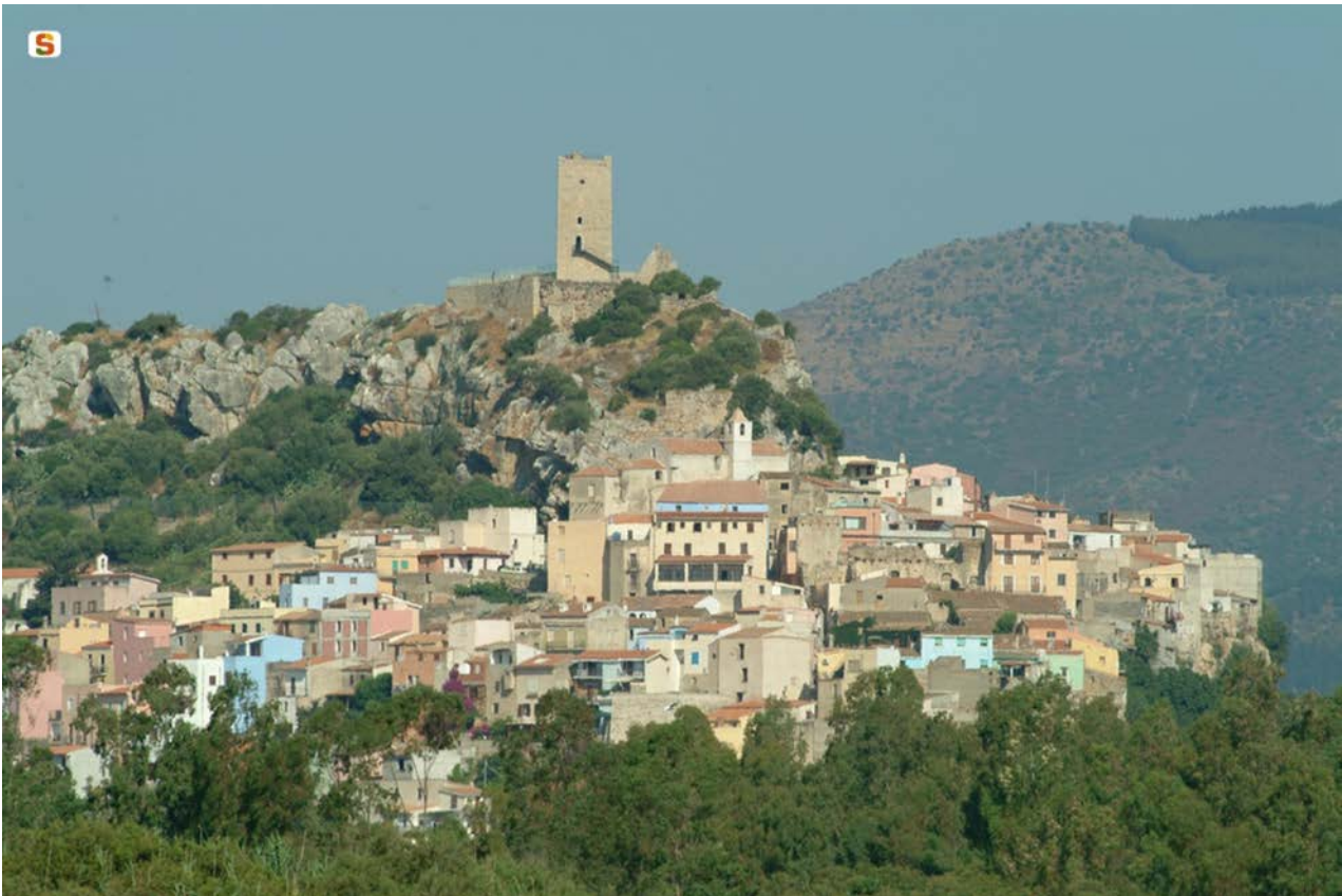
Abb. 3 - Posada, Fava-Burg ( http://www.sardegnaigitallibrary.it/index.php?xsl=615&s=17&v=9&c=4461&id=62931 ).

Die Visconti förderten den Bau von Burgen in der Gallura: Sie befestigten Civita, Posada und Orosei und errichteten die Burgen von Pedresu (Olbia), della Fava (Posada - Abb. 3) und Pontes (Galtelli), in denen sie wohnten, wenn sie sich fern ihrer Residenz in Civita aufhielten. Nach ihrem Exil aus Pisa gründeten sie Terranova und setzten die Bautätigkeit fort, die das Territorium der Gallura stark veränderten.