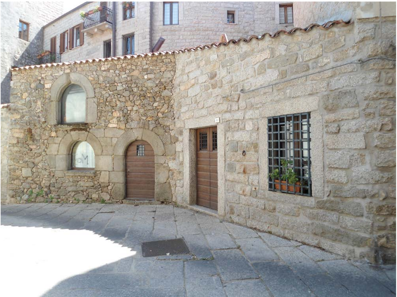
Abb. 2 - Tempel: Das so genannte Haus von Nino von Gallura.

Sardinien zu schützen, die durch die Gegenseite bedroht wurden. Außerdem erlangten sie nach dem Jahr 1258 die Herrschaft über ein Drittel des Judikats Cagliari. Diese internen Konflikte in Pisa im 13. Jahrhundert führten dazu, dass die Visconti aus der Stadt vertrieben wurden. Im Jahr 1276 folgte der Sohn Nino auf den Thron, er ca. 20 Jahre herrschte (Abb. 2), die Politik seines Vaters fortsetzte und sich mit den welfischen Städten gegen Pisa zusammenschloss; im Jahr 1288 wurde er gezwungen, seine toskanische Geburtsstadt zu verlassen, als sein Onkel Ugolino della Gherardesca seine Macht über Pisa verlor.