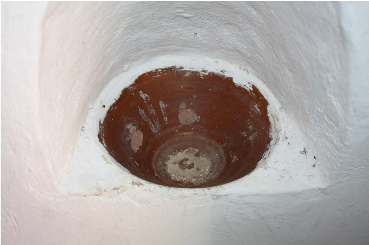
Fig. 4 - Luogosanto, Kirche Santo Stefano: Weihwasserbecken aus Keramik mit monochromer Glasur (Foto von F. Collu).

In der Nähe des Seiteneingangs ist ein Weihwasserbecken aus monochrom glasierter Keramik vorhanden (Abb. 4), es ist jedoch möglich, dass es ein anderes ersetzt, das in der Nähe des Brennofens gefunden wurde: Die Trümmer der Kalotte aus ligurischer Produktion von Ende des 19. Jahrhunderts können mit denen von San Smplicio di Lu Macchietu verglichen werden.