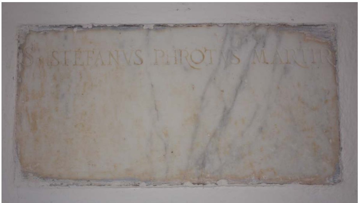
Abb. 3 - Luogosanto, Kirche Santo Stefano: Marmorepigraph.