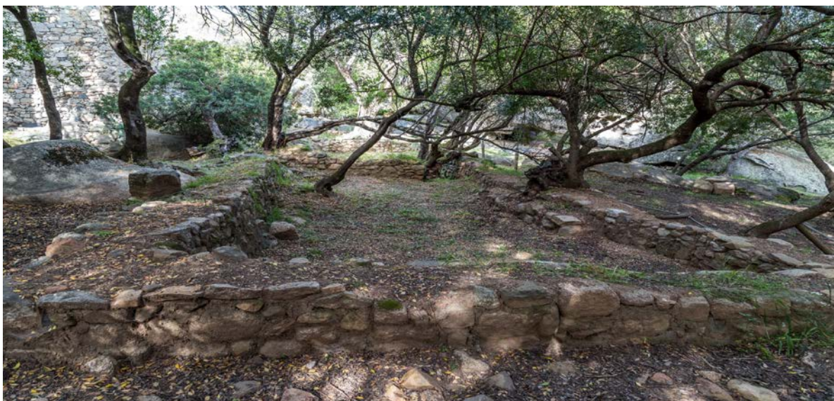
Abb. 3 - Palazzo di Baldu: Raum \kappa , gesehen von Westen.