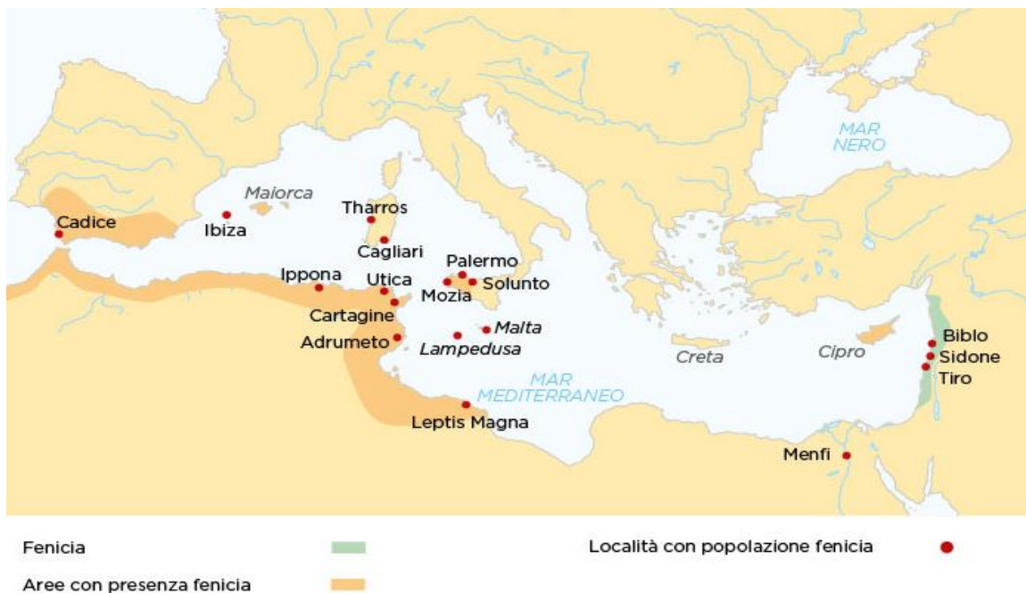
Abb. 3 - Die phönizische Kolonisierung mit Angabe der Stadtstaaten in Phönizien sowie der wichtigsten Expansionszentren.

Die letzteren stammten sehr wahrscheinlich aus Korsika und gehören der Gruppe der Völker der oberen Gallura an, die die phönizisch-punische Kolonisierung blockierten (Abb. 3) sich auch der römischen lange widersetzen.