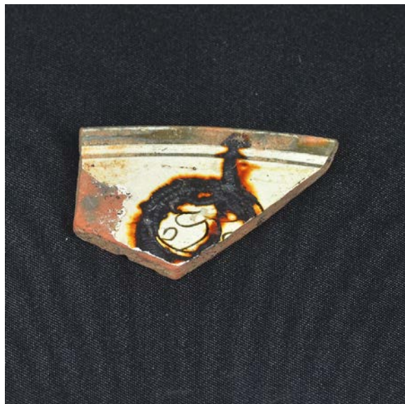
Abb. 1 - Luogosanto, Palazzo di Baldu: Fragment von Zeuxippus Ware (Innenfläche), (Foto von Unicity S.p.A.).

Eines der wertvollsten Erzeugnisse, die im Turm verwendet wurden, war wahrscheinlich eine Schale des Typs Zeuxippus Ware (Abb. 1-2), die zwischen Ende des 12. Jahrhunderts und dem 13. Jahrhundert n. Chr. produziert wurde. Während der Grabungsarbeiten wurde ein Fragment eines Rands mit Stabdekor sowie einer tiefe Furche unmittelbar unter dem Rand gefunden, charakterisiert durch einen dunkelgrünen Steifen sowie einem Motiv mit stilisierten Palmzweigen in zwei konzentrischen Kreisen.