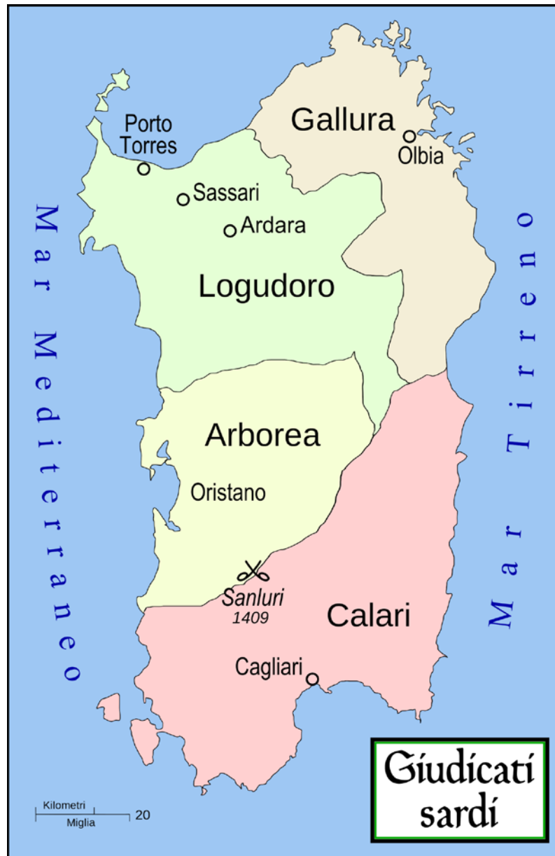
Abb. 3 - Karte der sardischen Judikate.