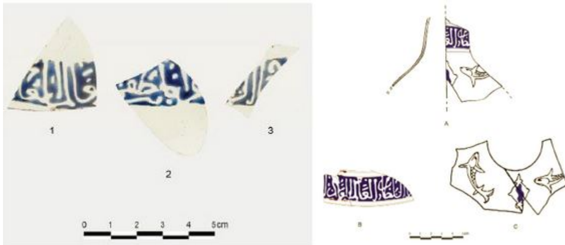
Abb. 1 - Luogosanto, Palazzo di Baldu: grafische Darstellung der gefundenen Fragmente (aus: PINNA, MUSIO 2012, S. 322, Abb. 10-11).

Während der Grabungsarbeiten in den Jahren 2001 und 2002 wurden im Inneren der drei Räume ( \eta , \theta , \iota ) im Süden des Palazzos von Baldu einige Glasfragmente gefunden, die von Lampen aus syrischer oder ägyptischer Produktion stammen (Abb. 1).